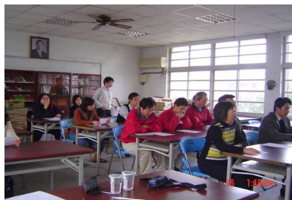
全校教職員工參加急救教育 CPR 研習訓練活動