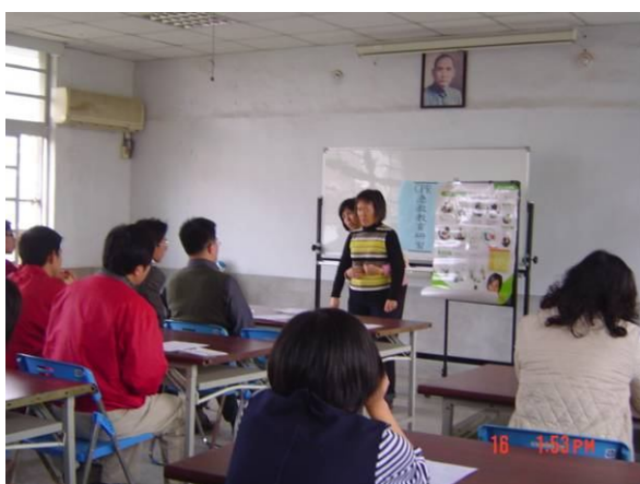
急救教育 CPR 研習上課情形