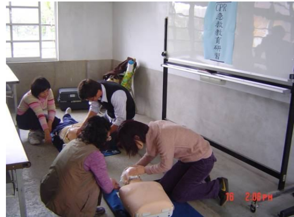
學校老師們參加學校教職員工急救教育 CPR 研習訓練活動情形