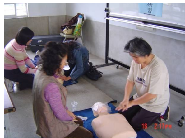
學校員工參加學校教職員工急救教育 CPR 研習訓練活動情形