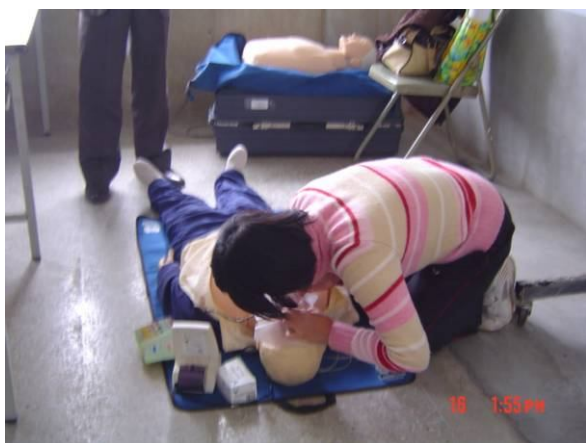
急救教育 CPR 研習訓練活動