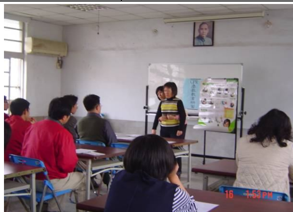
辦理學校教職員工急救教育 CPR 研習訓練活動