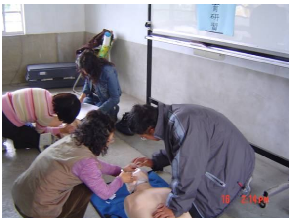
學校老師們參加學校教職員工急救教育 CPR 研習訓練活動情形