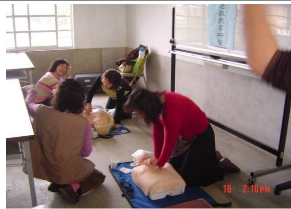
學校老師們參加學校教職員工急救教育 CPR 研習訓練活動情形