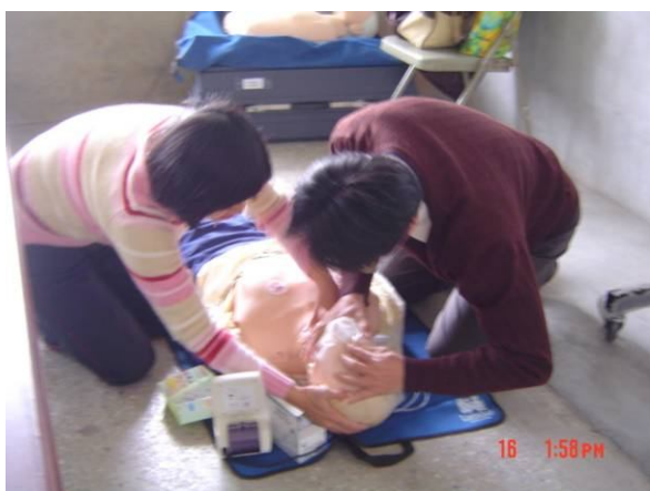
校長帶頭參加學校教職員工急救教育 CPR 研習訓練活動