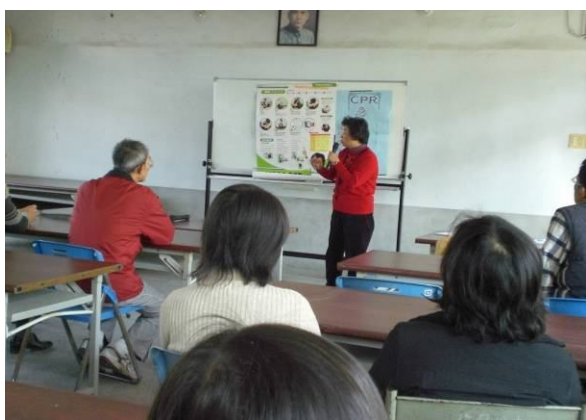
急救教育 CPR 研習上課情形