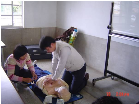
學校老師參加學校教職員工急救教育 CPR 研習訓練活動情形