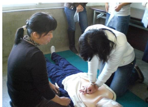
學校老師們參加學校教職員工急救教育 CPR 研習訓練活動情形