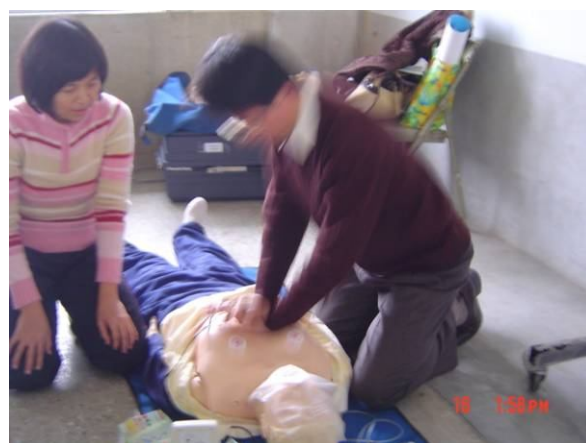
校長認真參加學校教職員工急救教育 CPR 研習訓練活動情形