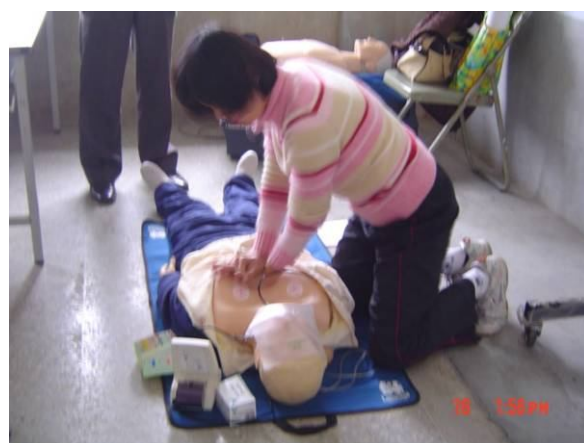
急救教育 CPR 研習上課情形