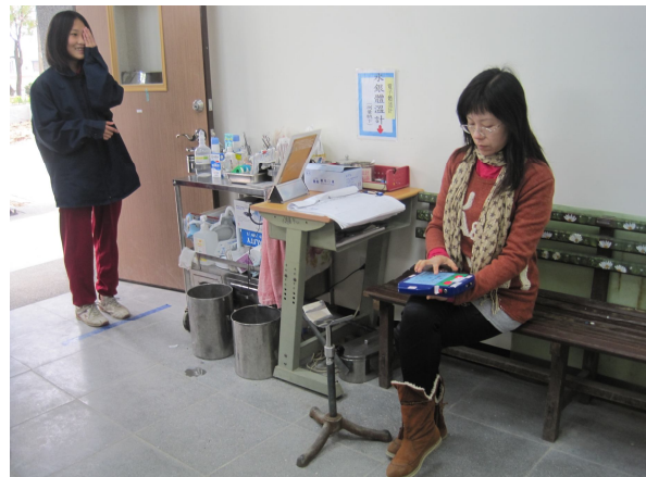
每學期定期測量視力，以利及時發現視力不之學生，