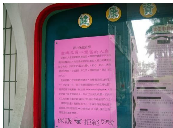
健康櫥窗宣導如何好好愛護我們的視力