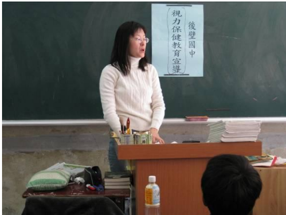
視力保健宣導活動，學生都能全程參與教學