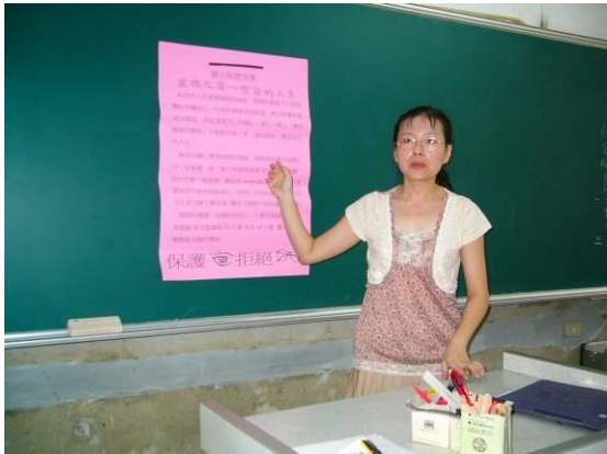
視力保健宣導活動