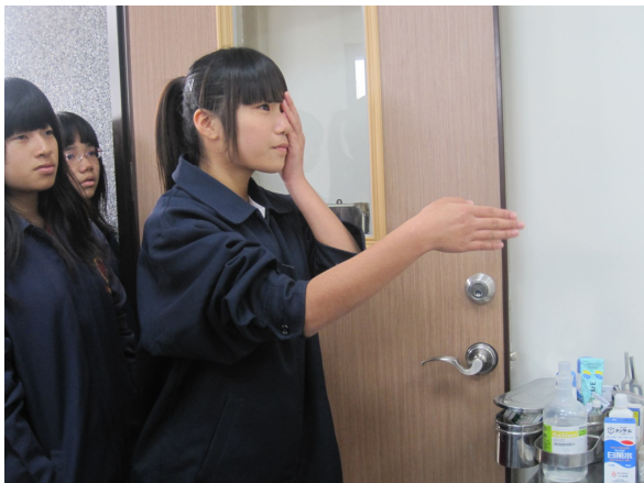
每學期定期測量視力，以利及時發現視力不之學生，