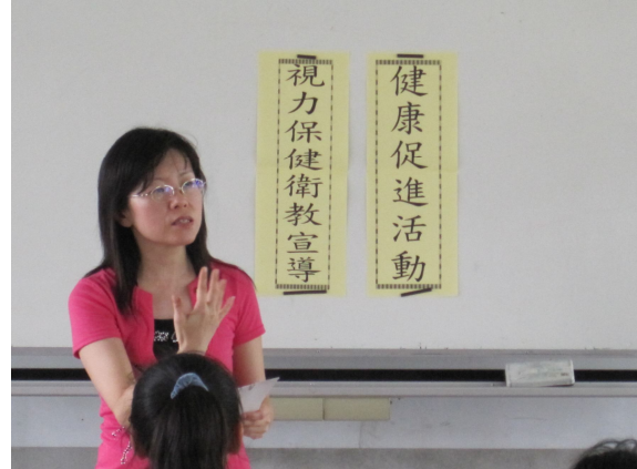
視力保健宣導活動，學生都能全程參與教學