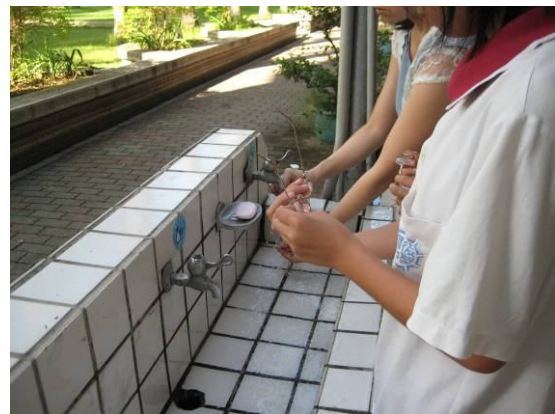
對於已佩戴眼鏡學生， 給予如何清洗眼鏡之衛教及指導