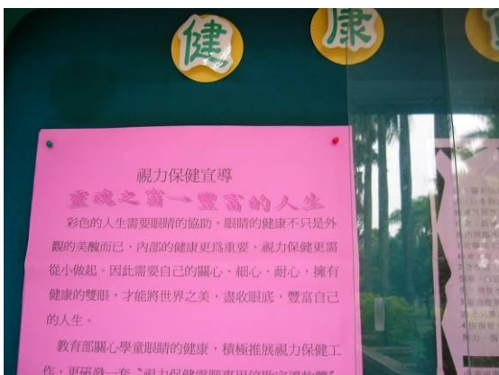
健康櫥窗宣導視力保健的重要