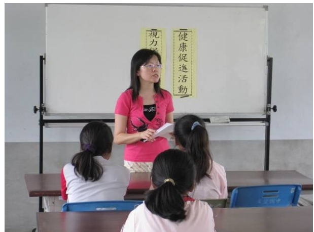
視力保健宣導活動