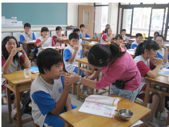
健康教師指導學生正確刷牙方法教學