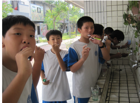
學生於午餐後進行餐後潔牙活動情形