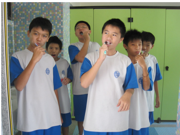
學生於午餐後進行餐後潔牙活動情形