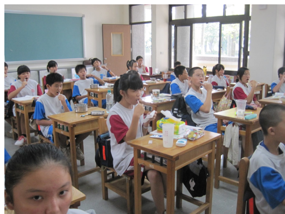
健康教師到班級進行口腔保健宣導活動，學生都能正確使用牙刷全程參與活動