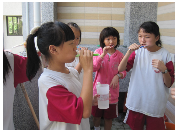
學生於午餐後進行餐後潔牙活動情形