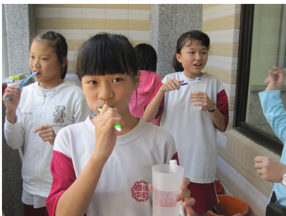
學生於午餐後進行餐後潔牙活動情形