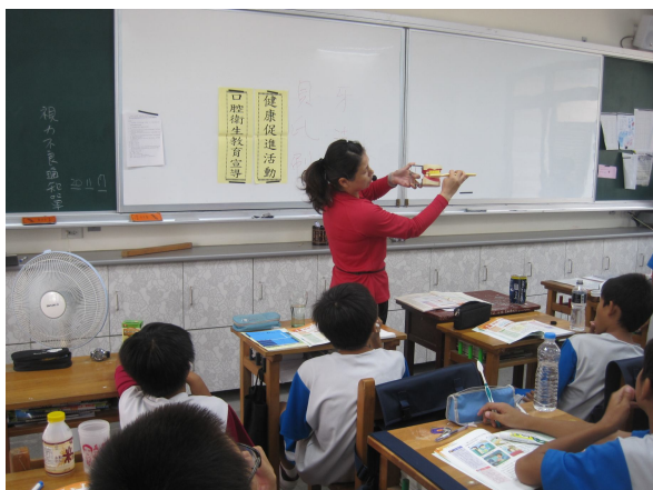
課程融入-教師指導學生正確刷牙方法教學