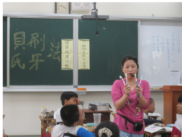
健康教師到班級進行口腔保健宣導活動，學生都能全程參與教學