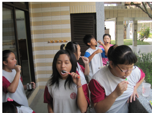
學生於午餐後進行餐後潔牙活動情形