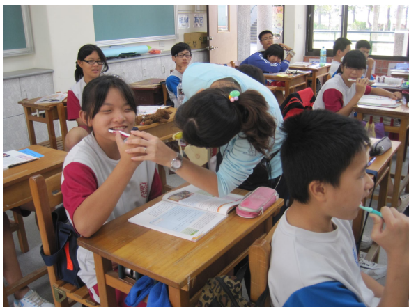
健康教師指導學生正確刷牙方法教學