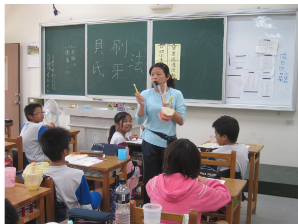
課程融入-教師指導學生正確刷牙方法教學