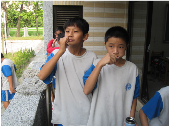
學生於午餐後進行餐後潔牙活動情形