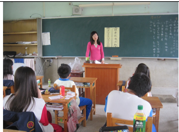
健康檢查口腔異常個案，即時給予口腔保健衛教並分發異常通知單