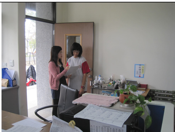
口腔檢查，對於口腔檢查有異常之學生，即時給予口腔保健衛教