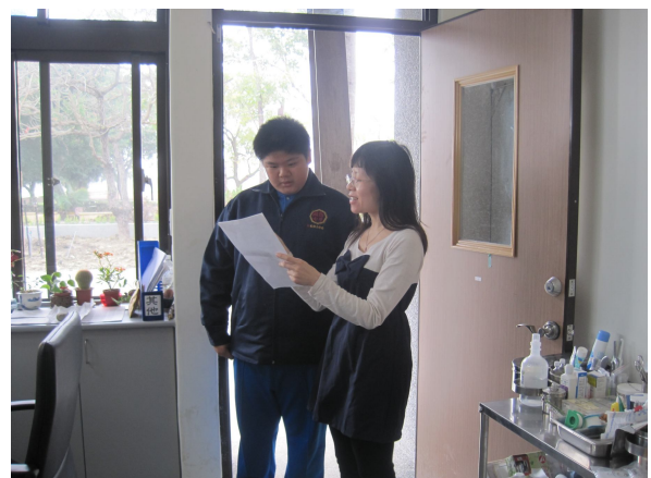
口腔檢查，對於口腔檢查有異常之學生，即時給予口腔保健衛教