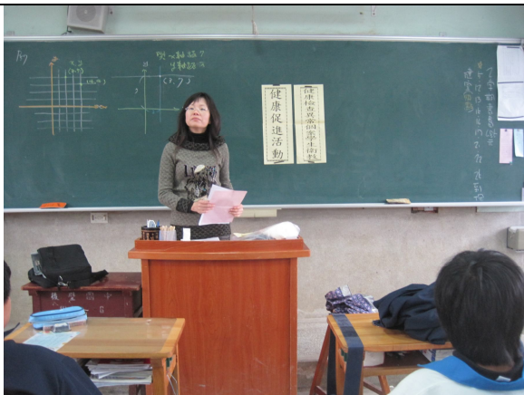
健康檢查口腔異常個案，即時給予口腔保健衛教並分發異常通知單