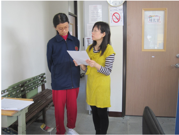
實施口腔檢查，對於口腔檢查有異常之學生，即時給予口腔保健衛教