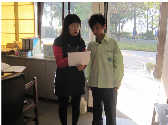
口腔檢查，對於口腔檢查有異常之學生，即時給予口腔保健衛教