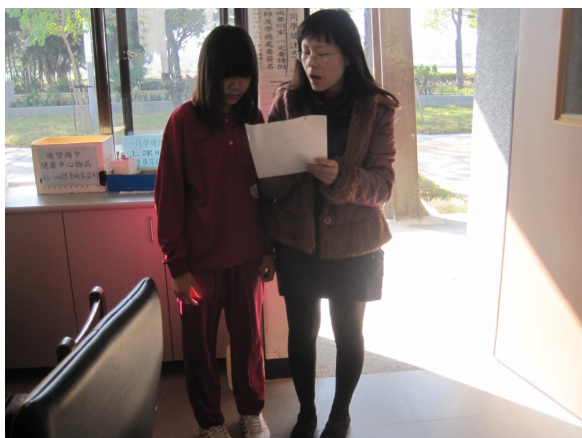
口腔檢查，對於口腔檢查有異常之學生，即時給予口腔保健衛教