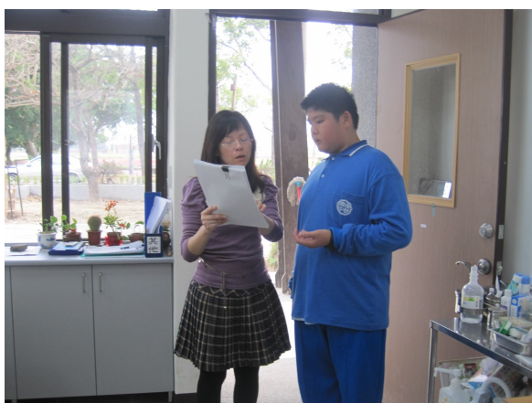
口腔檢查，對於口腔檢查有異常之學生，即時給予口腔保健衛教