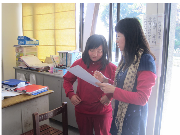
口腔檢查，對於口腔檢查有異常之學生，即時給予口腔保健衛教