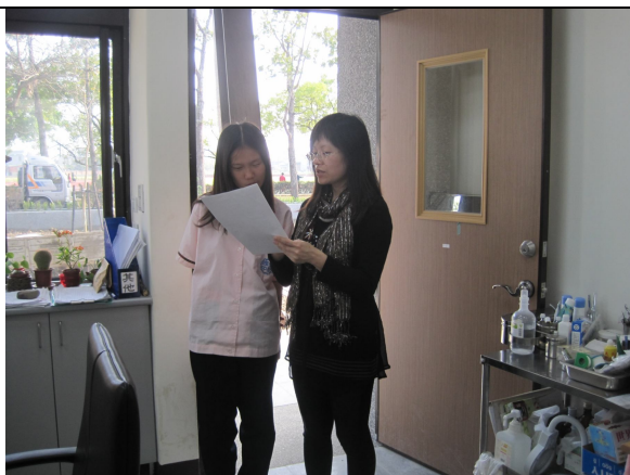
口腔檢查，對於口腔檢查有異常之學生，即時給予口腔保健衛教