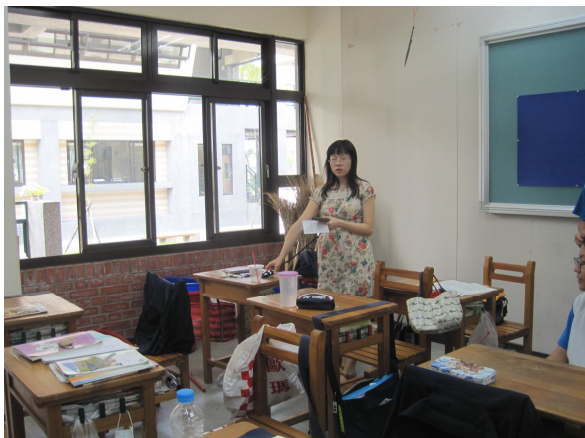
每學期進行班級桌面照度檢查， 黑板不低於 350 米燭光