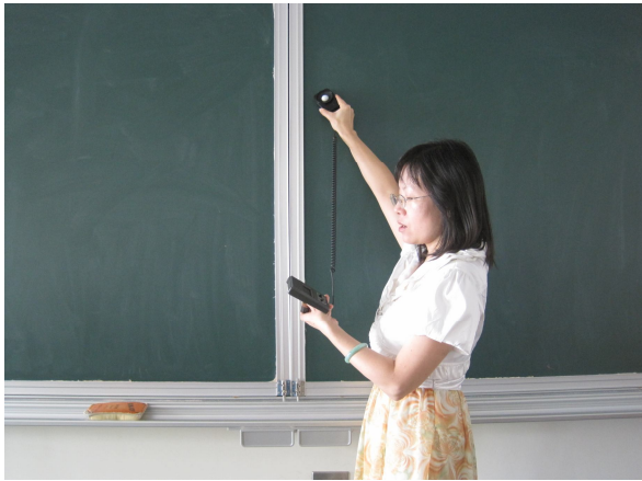
每學期進行黑板照度檢查， 黑板不低於 500 米燭光