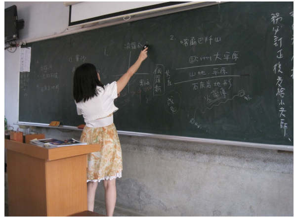
每學期進行黑板照度檢查， 黑板不低於 500 米燭光