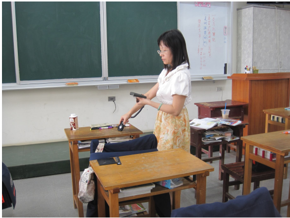
每學期進行班級桌面照度檢查， 黑板不低於 350 米燭光