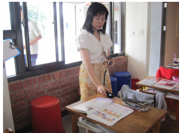
每學期進行班級桌面照度檢查， 黑板不低於 350 米燭光