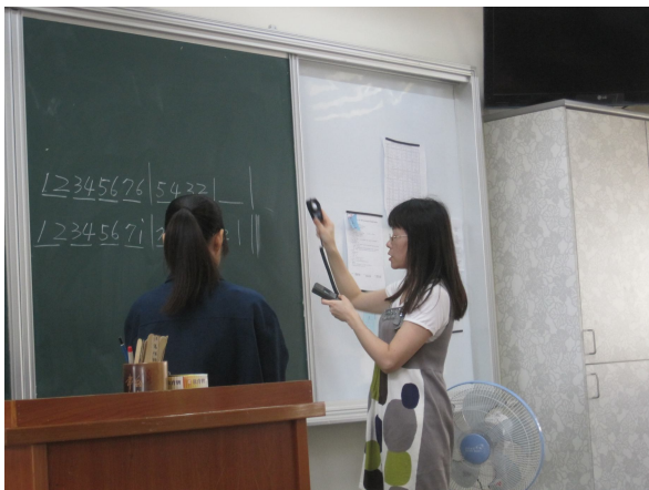
每學期進行黑板照度檢查， 黑板不低於 500 米燭光