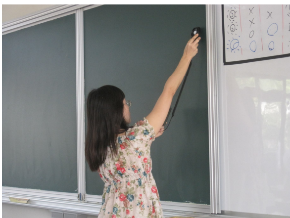
每學期進行黑板照度檢查， 黑板不低於 500 米燭光