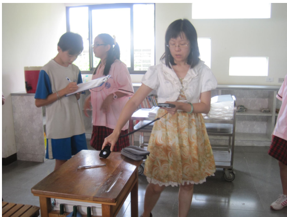
每學期進行班級桌面照度檢查， 黑板不低於 350 米燭光