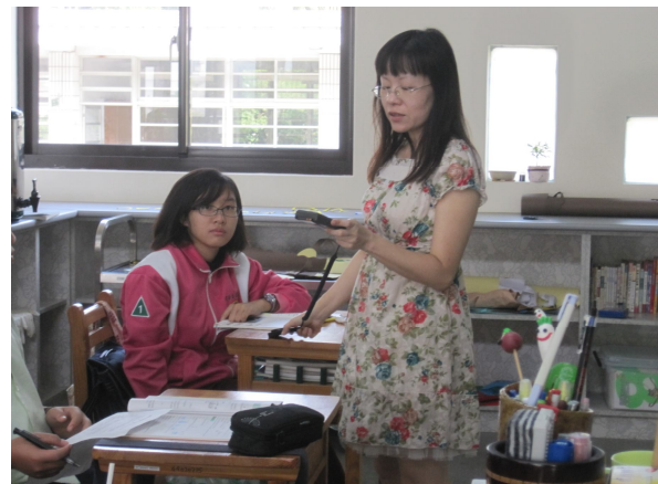
每學期進行班級桌面照度檢查， 黑板不低於 350 米燭光