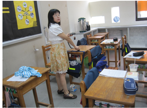
每學期進行班級桌面照度檢查， 黑板不低於 350 米燭光