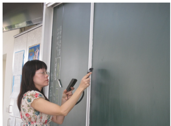
每學期進行黑板照度檢查， 黑板不低於 500 米燭光