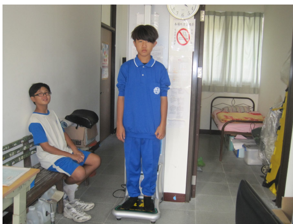
定期測量過輕學生體重， 以監測學生體重變化