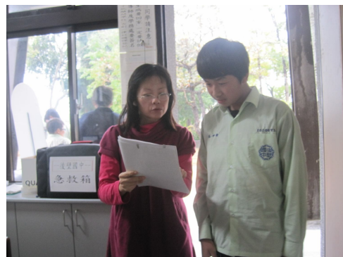
對於體重過重之學生，分發體重過輕通知單，給予健康飲食及健康體重衛教衛教