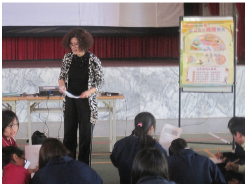
後壁衛生所前來作健康飲食宣導， 教導正確健康飲食觀念