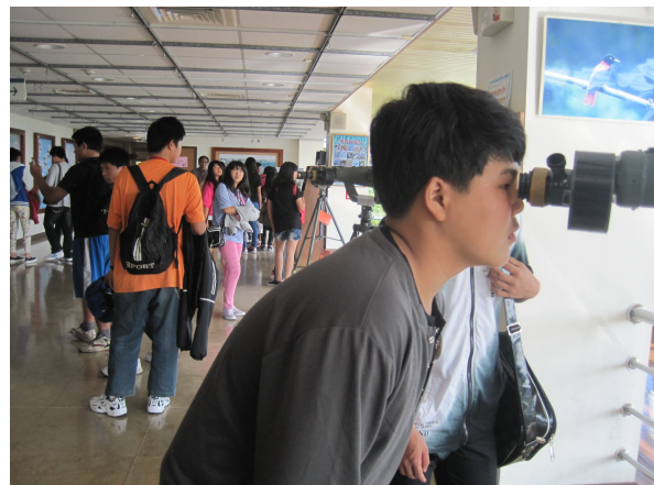
學校舉辦校外參觀，提供學生放鬆心情，保持心情愉快，幫助增加食慾