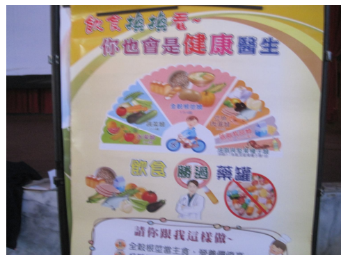
健康飲食海報宣導