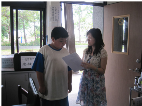
對於體重過重之學生，分發體重過輕通知單，給予健康飲食及健康體重衛教衛教