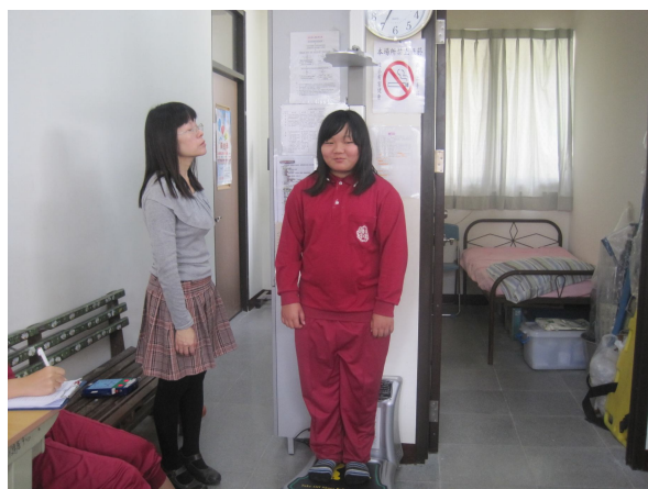
定期測量過重學生體重， 以監測學生體重變化