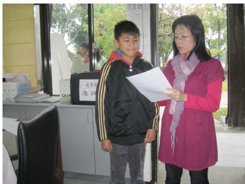
對於體重過輕之學生，分發體重過輕通知單，給予健康飲食及健康體重衛教衛教