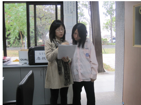
對於體重過輕之學生，分發體重過輕通知單，給予健康飲食及健康體重衛教衛教