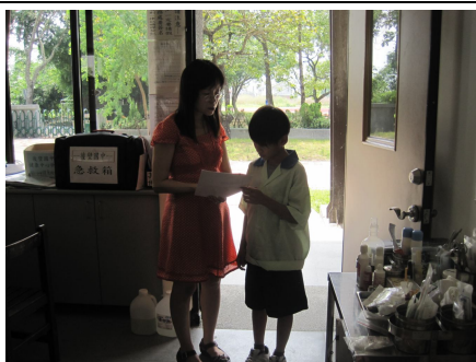
對於體重過輕之學生，分發體重過輕通知單，給予健康飲食及健康體重衛教衛教