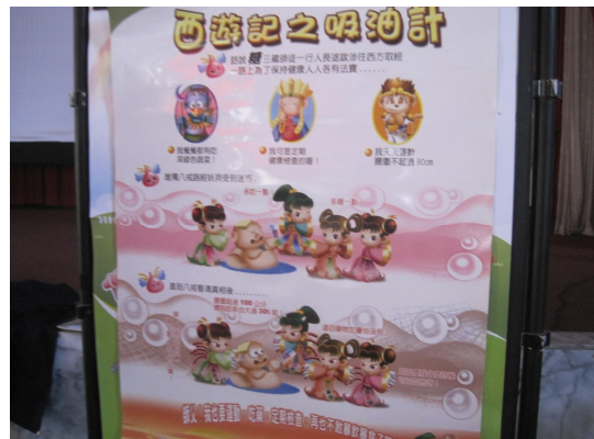
健康飲食海報宣導 教導體重控制觀念