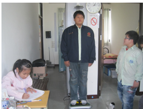
定期測量過重學生體重， 以監測學生體重變化