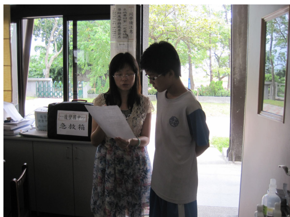
實施體重檢查後，對於體重過輕之學生， 即時給予體重過輕衛教注意事項