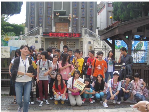
學校舉辦校外參觀，提供學生放鬆心情，保持心情愉快，幫助增加食慾