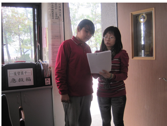
實施體重檢查後，對於體重過重之學生， 即時給予體重過輕衛教注意事項