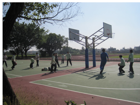
學生下課適當運動打籃球，以促進食慾