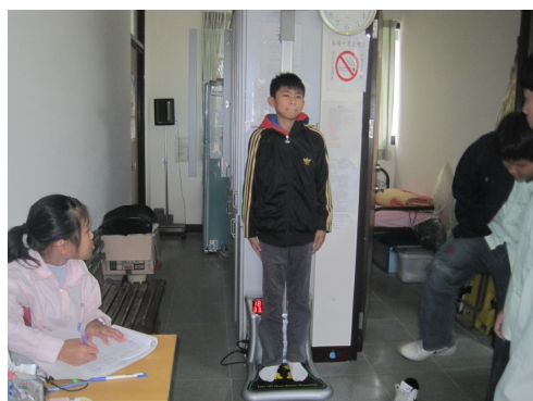
定期測量過輕學生體重， 以監測學生體重變化