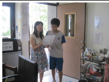
對於體重過輕之學生，分發體重過輕通知單，給予健康飲食及健康體重衛教衛教