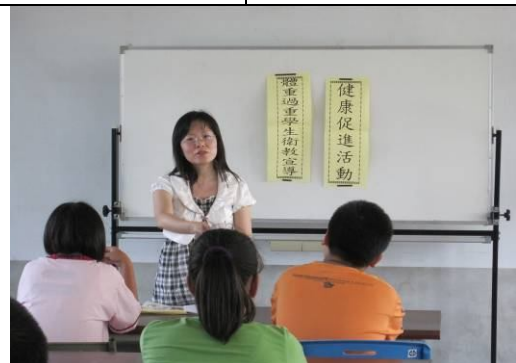
班級健康體位控制宣導， 教導正確體重控制觀念