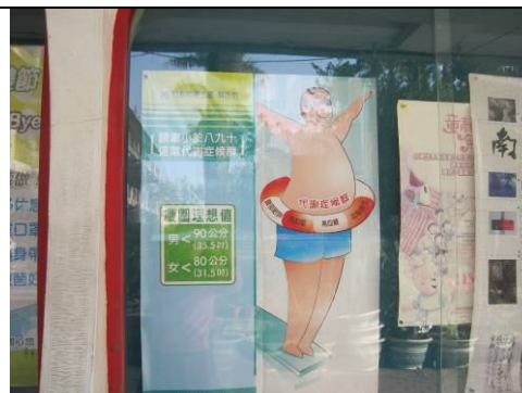
健康櫥窗--健康腹圍宣導 教導定期測量腹圍觀念