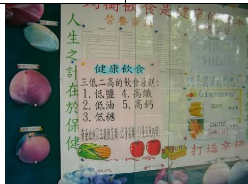
健康櫥窗健康飲食宣導