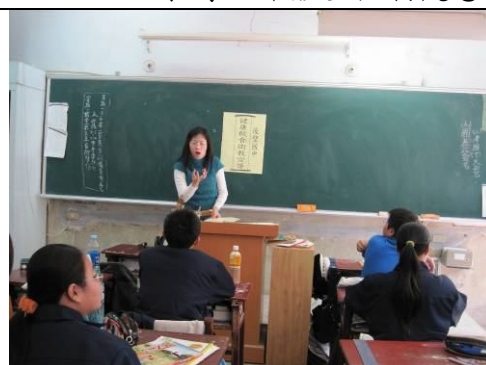
班級健康飲食宣導， 教導正確健康飲食觀念