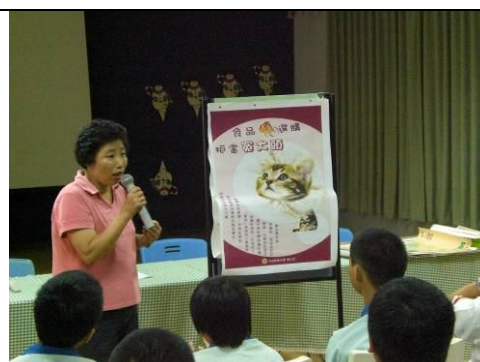
後壁衛生所前來作健康飲食宣導， 教導正確健康飲食觀念