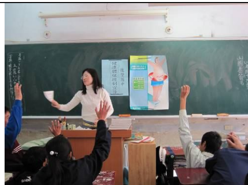
班級健康體位控制宣導， 教導正確體重控制觀念