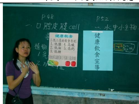
班級健康飲食宣導， 教導正確健康飲食觀念