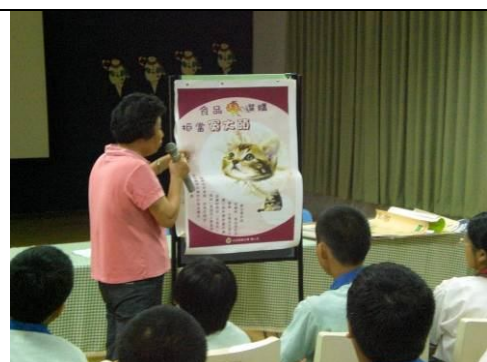
後壁衛生所前來作健康飲食宣導， 教導正確健康飲食觀念