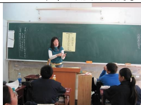
班級健康飲食宣導， 教導正確健康飲食觀念