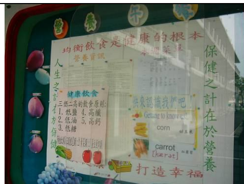
健康櫥窗健康飲食宣導