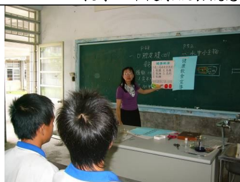
班級健康飲食宣導， 教導正確健康飲食觀念