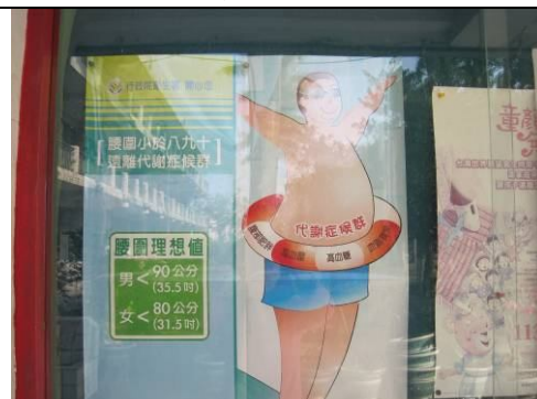
健康櫥窗--健康腹圍宣導 教導定期測量腹圍觀念