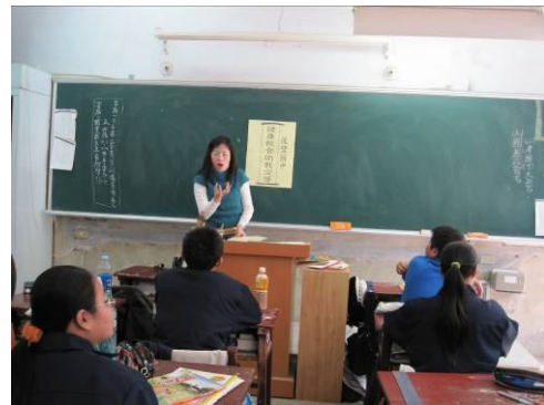
班級健康飲食宣導， 教導正確健康飲食觀念