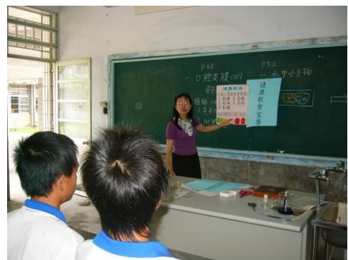
班級健康飲食宣導， 教導正確健康飲食觀念