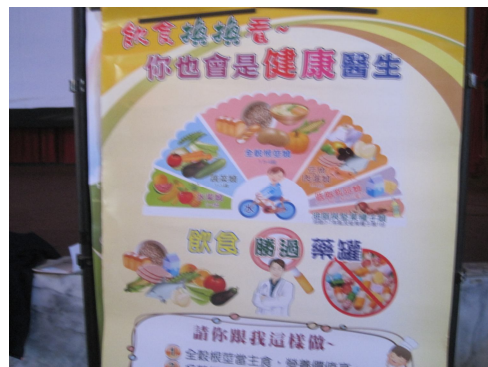
健康飲食海報宣導