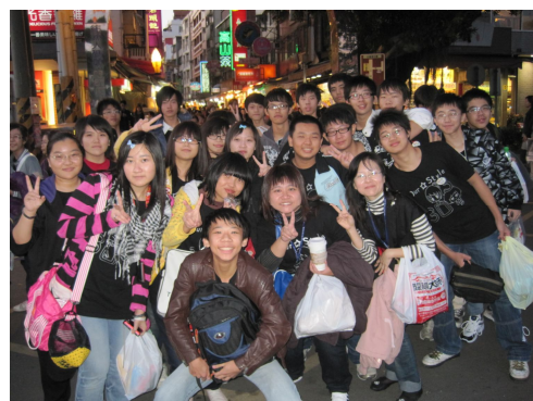
學校舉辦校外參觀，提供學生放鬆心情，保持心情愉快，幫助增加食慾