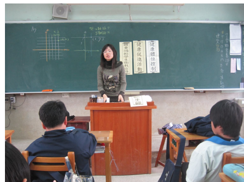
班級健康體位控制宣導， 教導正確體重控制觀念