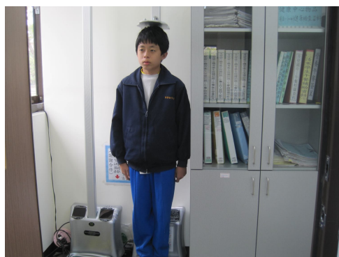
定期測量過輕學生體重， 以監測學生體重變化