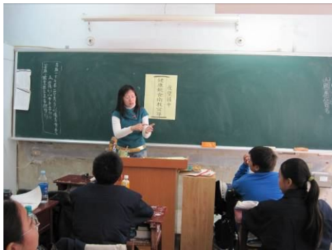
班級健康飲食宣導， 教導正確健康飲食觀念