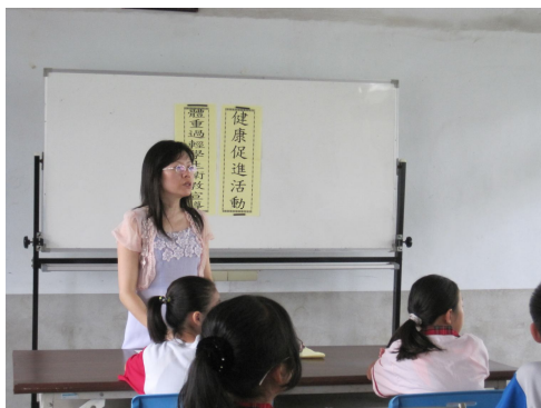
班級健康體位控制宣導， 教導正確體重控制觀念