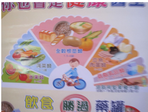
健康飲食海報宣導