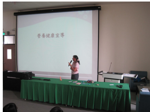
後壁衛生所前來作健康飲食宣導， 教導正確健康飲食觀念