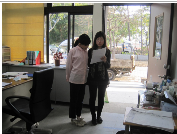
實施體重檢查後，對於體重過輕之學生， 即時給予體重過輕衛教注意事項