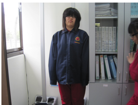
定期測量過重學生體重， 以監測學生體重變化