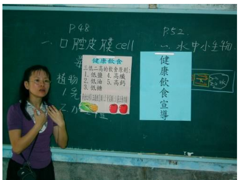
班級健康飲食宣導， 教導正確健康飲食觀念