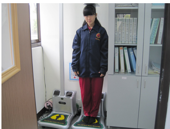
定期測量過輕學生體重， 以監測學生體重變化