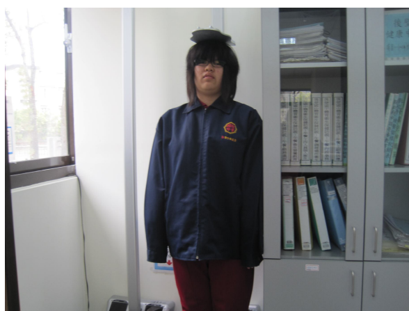
定期測量過重學生體重， 以監測學生體重變化