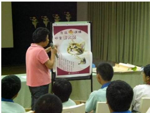
後壁衛生所前來作健康飲食宣導， 教導正確健康飲食觀念