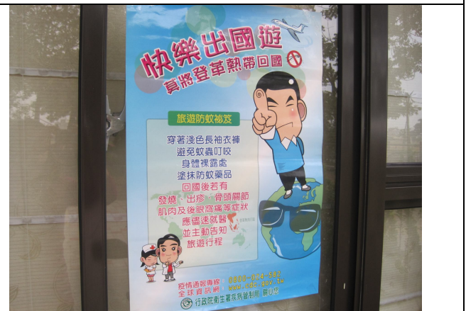
辦理季節性傳染病 (登革熱) 海報宣導活動