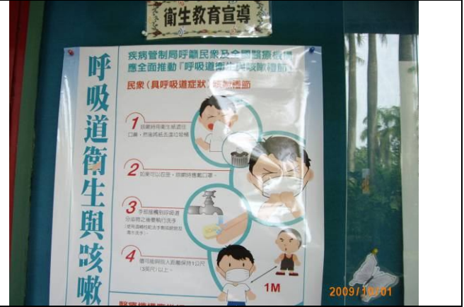
健康櫥窗辦理季節性傳染病 (防治流感疾病注意事項) 海報宣導活動