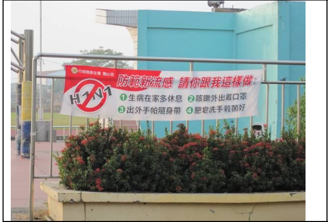
學校校門口懸掛季節性傳染病 (防治H1N1 疾病注意事項) 紅布條宣導活動