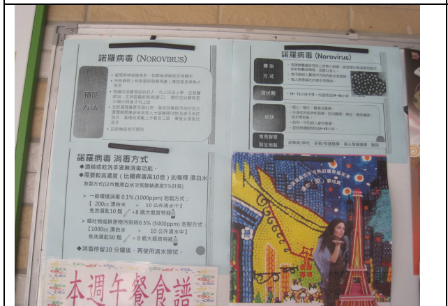
辦理季節性傳染病 (諾羅病毒) 海報宣導活動