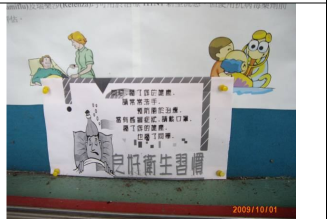
辦理季節性傳染病 (防治流行性感冒) 海報宣導活動