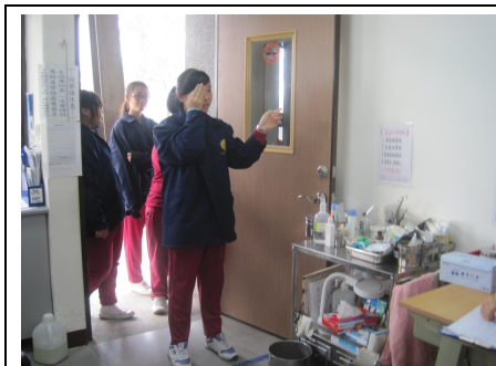
定期辦理視力檢查