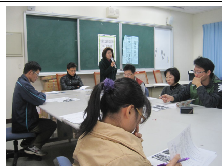
召開學校衛生工作會議 (進行討論視力建議改善)