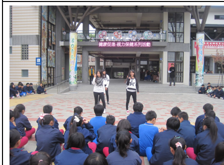
視力保健系列活動 (學生跳舞表演活動)