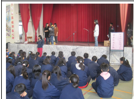
視力保健系列活動 (結合聖誕節表演節目活動)