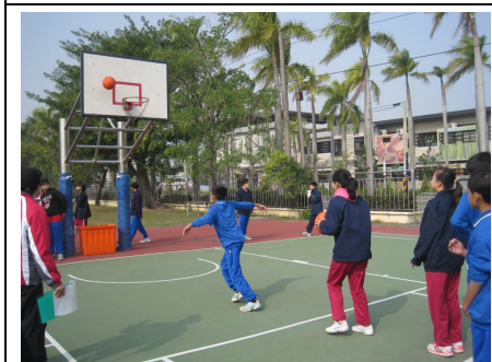
學生下課常一起打籃球，有益視力保健