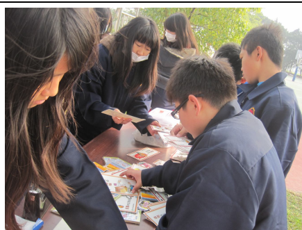
運動會擴大視力保健宣導，進行視力保健對對碰遊戲活動