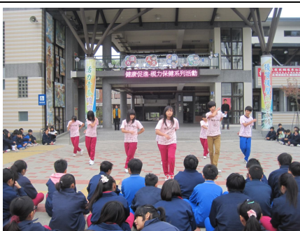
視力保健系列活動 (學生跳舞表演活動)