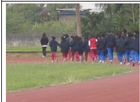
集體跑操場活動集體遠眺休息，有益視力保健