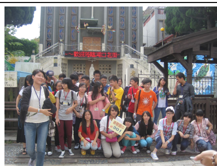
一、二、三年級戶外教學