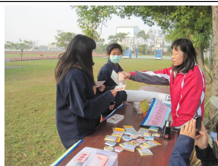
運動會擴大視力保健宣導，進行視力保健有獎徵答活動