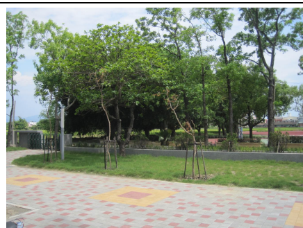
綠意盎然的校園有益視力保健