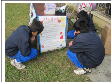
運動會擴大視力保健宣導