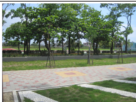
綠意盎然的校園有益視力保健