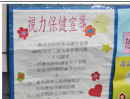
健康櫥窗視力保健宣導