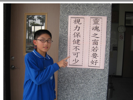
張貼視力保健宣導標語