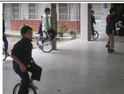
學生下課常騎獨輪車，有益視力保健