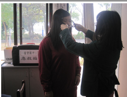
教導正確戴眼鏡方法，有益視力保健