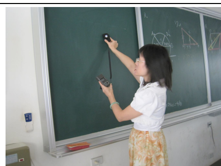
定期檢測教室照光度，以確保光線充足，有益視力保健