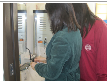
教導學生正確清洗眼鏡方法