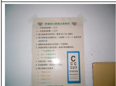
確實遵守並張貼正確測量視力方式