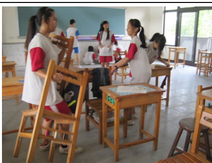
辦理新型課桌椅更換，替換適合自己身高的課桌椅，有益視力保健