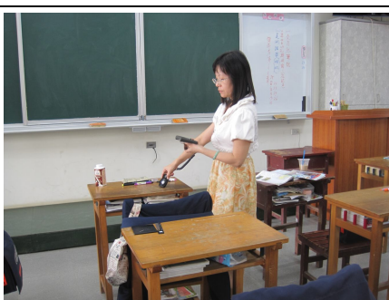
定期檢測教室照光度，以確保光線充足，有益視力保健