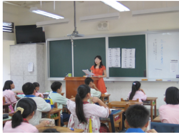
視力保健宣導活動，學生都能全程參與教學