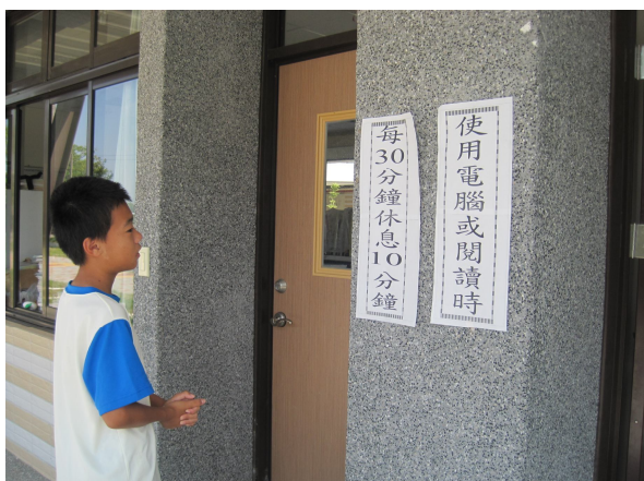
張貼宣導標語--如何好好愛護我們的視力