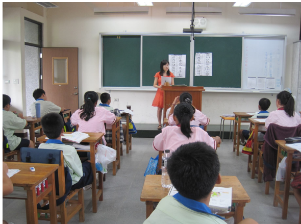
視力保健宣導活動