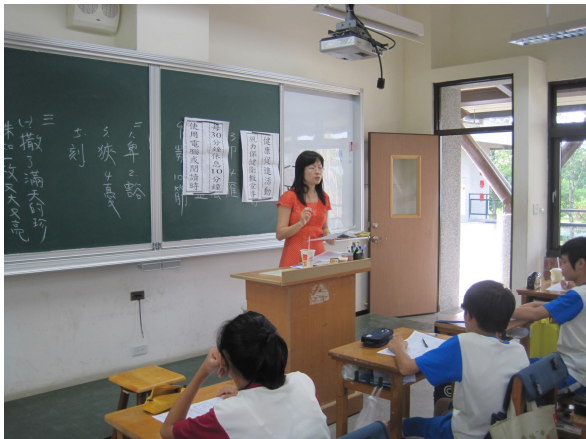
視力保健宣導活動