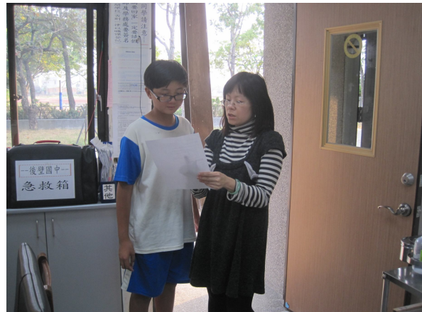
對於視力不良之學生， 給予視力保健衛教