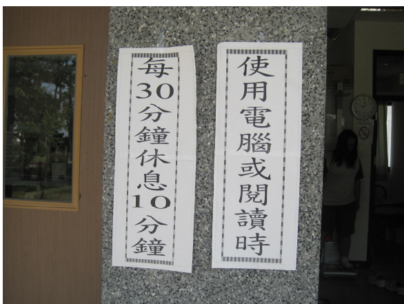
張貼宣導標語-宣導視力保健的重要