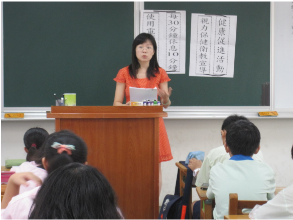
視力保健宣導活動，學生都能全程參與教學