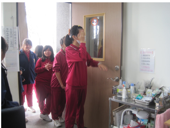
每學期定期測量視力， 以利及時發現視力不之學生，