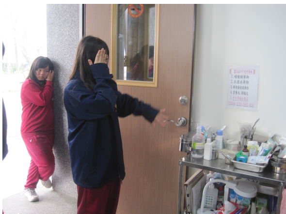
每學期定期測量視力， 以利及時發現視力不之學生，