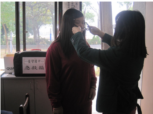
對於已佩戴眼鏡學生， 給予戴眼鏡之衛教