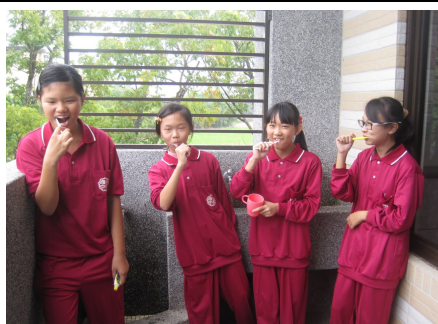
全校學生餐後潔牙情形