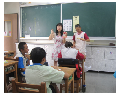
護理師衛教良好口腔衛生