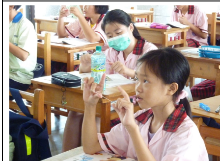
口腔衛生保健宣導 (學生回覆示教牙線使用情形)