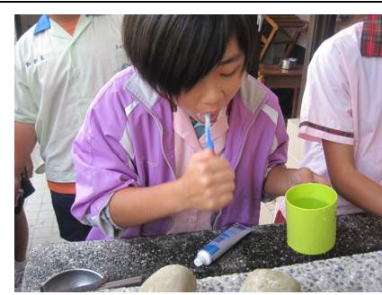
全校學生餐後潔牙情形