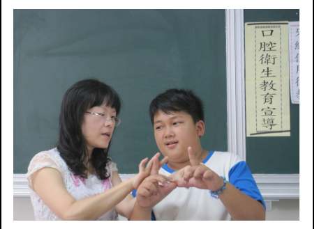
學生回覆示教牙線的使用