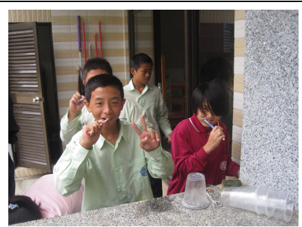
全校學生餐後潔牙情形