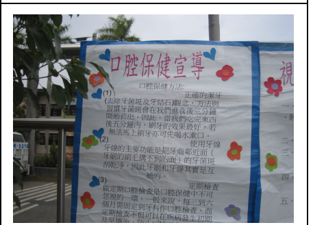
健康促進宣導活動-口腔保健