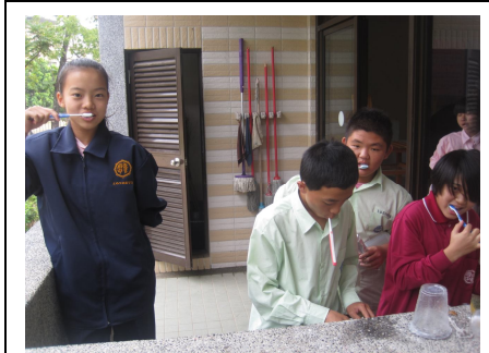
全校學生餐後潔牙情形