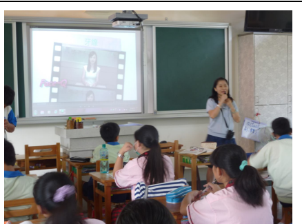
課程融入口腔衛生教學活動 教導正確牙線使用方法