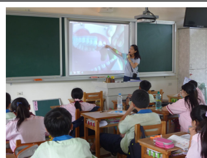
口腔衛生保健宣導， 教導正確口腔保健方法