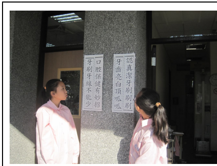
學生觀看口腔保健宣導標語情形