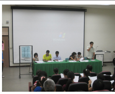
口腔保健家長宣導