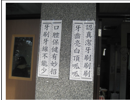
口腔保健宣導標語情形