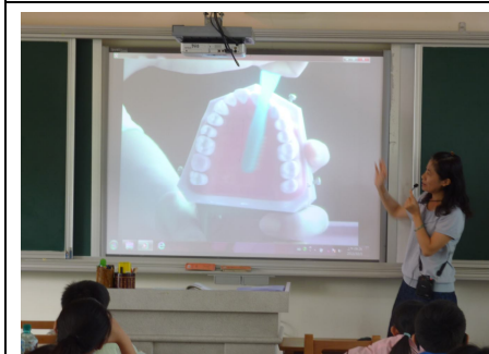
課程融入口腔衛生教學活動 教導正確刷牙方法