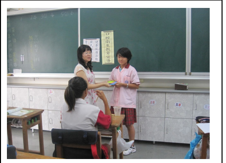
護理師宣導良好口腔衛生 (有獎徵答情形)