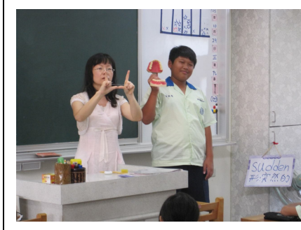
護理師教導牙線使用