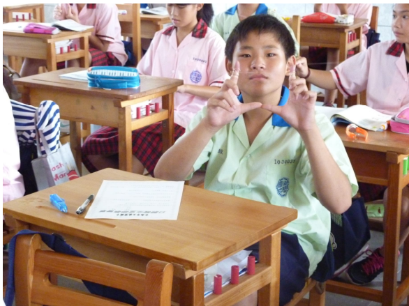
學生正確(牙線操作)方法