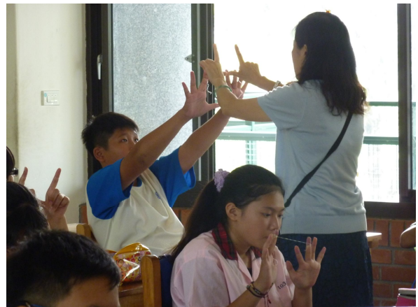
健康教師指導學生正確(牙線操作)方法教學