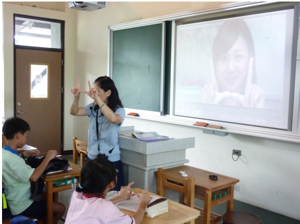
健康教師到班級進行口腔保健(牙線操作)宣導活動，學生都能全程參與教學