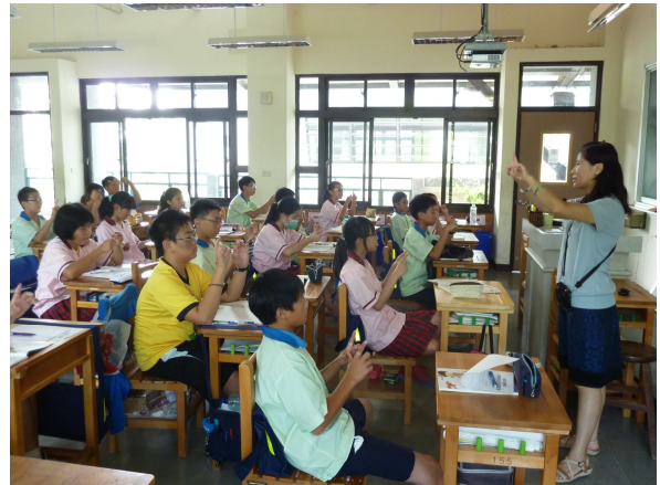
健康教師到班級進行口腔保健(牙線操作)宣導活動，學生都能全程參與教學