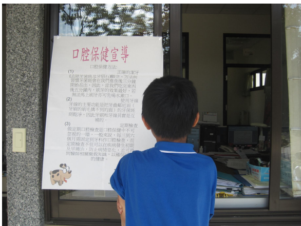
張貼口腔保健宣導口腔保健的重要