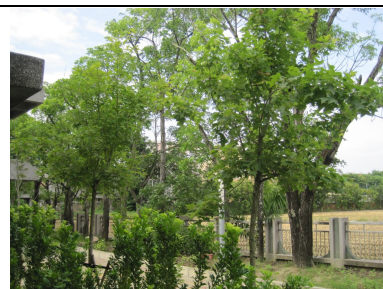
綠意盎然的校園有益視力保健