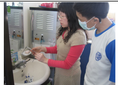
教導學生正確清洗眼鏡方法