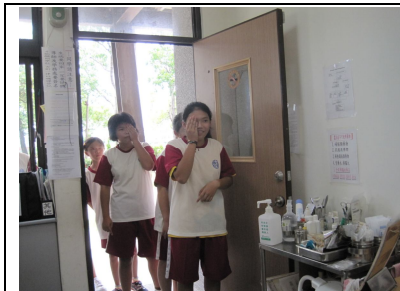
定期辦理視力檢查