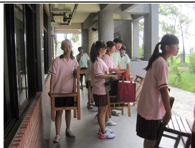
辦理新型課桌椅更換，替換適合自己身高的課桌椅，有益視力保健