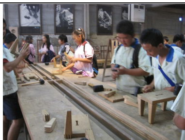
一、二、三年級戶外教學 有益視力保健