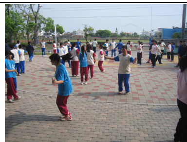
下課時間學生跳繩戶外活動集體遠眺休息，有益視力保健