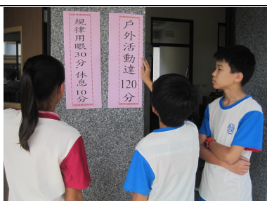
張貼視力保健宣導標語宣導 (學生觀看標語情形)