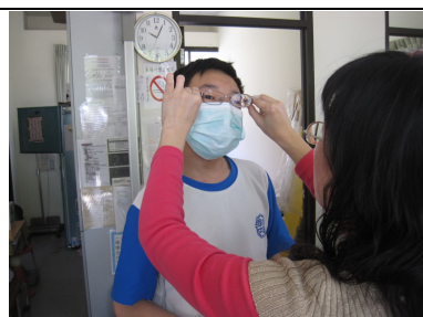
教導正確戴眼鏡方法，有益視力保健