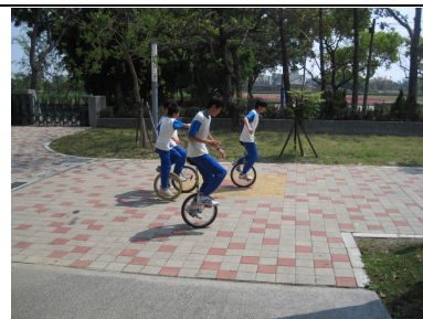
學生下課常騎獨輪車 ，有益視力保健