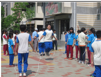
下課時間學生跳繩戶外活動集體遠眺休息，有益視力保健