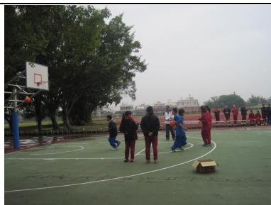
學生下課常一起打籃球 ，有益視力保健