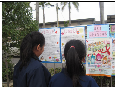
運動會擴大視力保健宣導