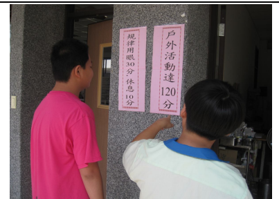
張貼視力保健宣導標語宣導