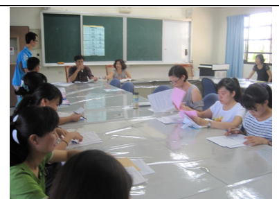
召開學校衛生工作會議 (進行討論視力建議改善)