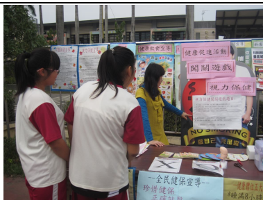
運動會擴大視力保健宣導 ，進行視力保健有獎徵答活動