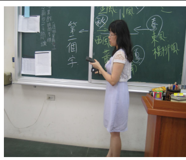
定期檢測教室照光度，以確保光線充足，有益視力保健