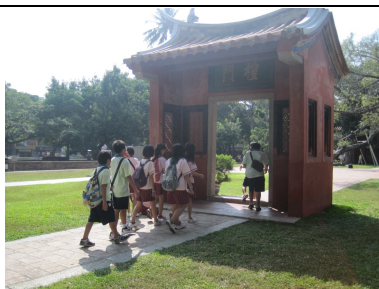
一、二、三年級戶外教學 有益視力保健