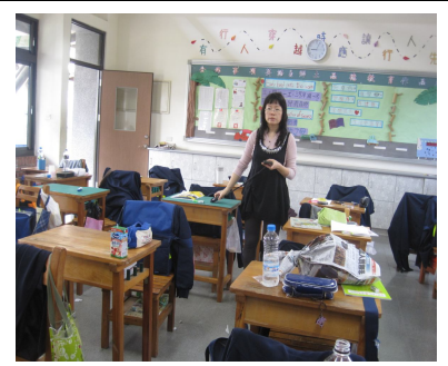
定期檢測教室照光度，以確保光線充足，有益視力保健