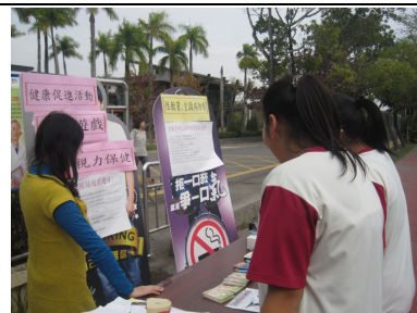
運動會擴大視力保健宣導 ，進行視力保健有獎徵答活動