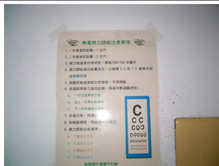
確實遵守並張貼正確測量視力方式