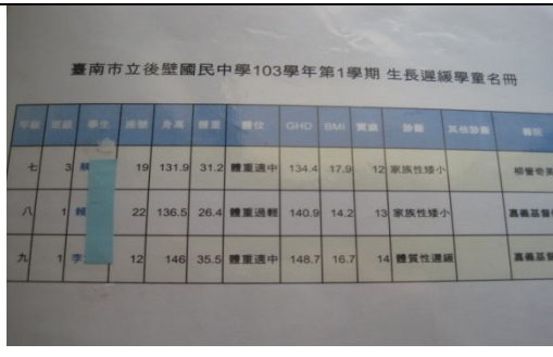
各項體格缺點矯治名冊