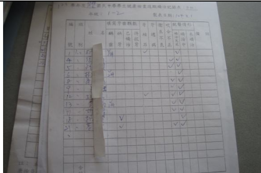
各項體格缺點學生皆能列冊管理，進行矯治追蹤工作，且有紀錄可查