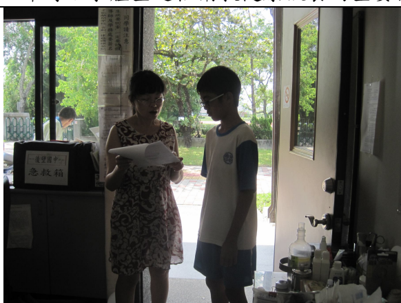
實施體重檢查後，對於體重過輕之學生，即時給予體重過輕衛教健康飲食的重要性