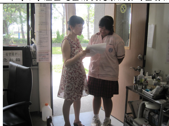
實施體重檢查後，對於體重過重之學生，即時給予體重過重衛教健康飲食的重要性