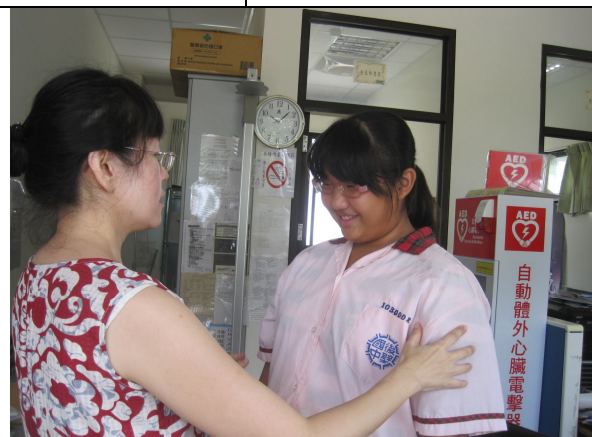
實施體重檢查後，對於體重過重之學生，即時給予體重過重衛教健康飲食的重要性