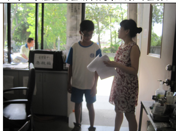
實施體重檢查後，對於體重過輕之學生，即時給予體重過輕衛教健康飲食的重要性