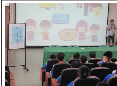
視力保健宣導活動