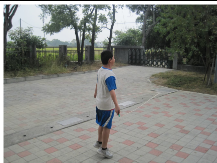
下課時間學生跳繩戶外活動集體遠眺 休息，有益視力保健