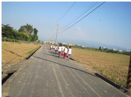
一年級自然課程進行戶外教學 水溝抓魚樂 (出發了~~)