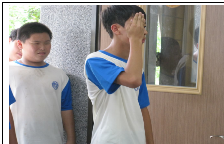
定期辦理視力檢查