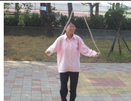
下課時間學生跳繩戶外活動集體 遠眺休息，有益視力保健