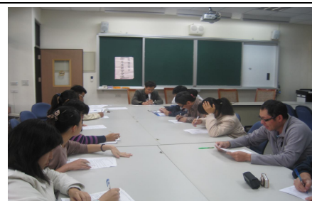
召開學校衛生工作會議 (進行討論視力建議改善)