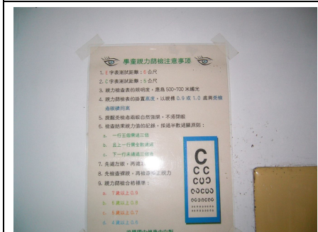
確實遵守並張貼正確測量視力方式