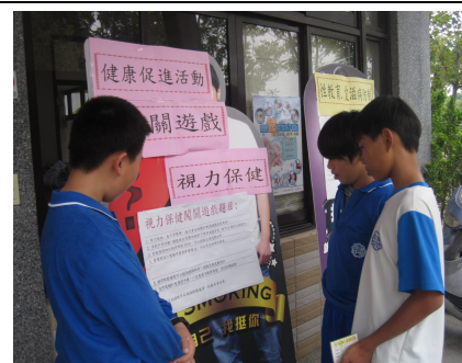
運動會擴大視力保健宣導 ，進行視力保健有獎徵答活動