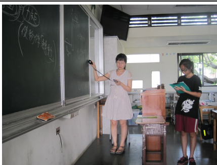
定期檢測教室照光度，以確保光線充足，有益視力保健