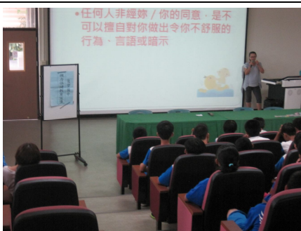
視力保健宣導活動