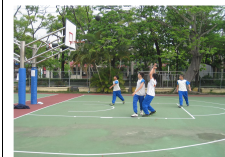
學生下課常一起打籃球 ，有益視力保健