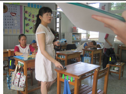
定期檢測教室照光度，以確保光線充足，有益視力保健