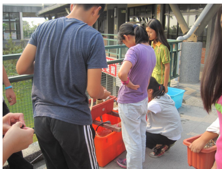
學生下課常學校進行魚菜共生種植. 有益視力保健