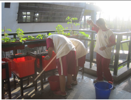
學生下課進行魚菜共生種植. 有益視力保健