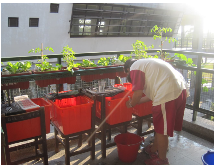
學生下課進行魚菜共生種植. 有益視力保健