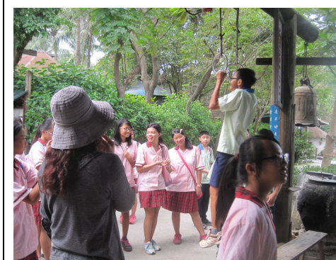
一、二、三年級戶外教學 有益視力保健