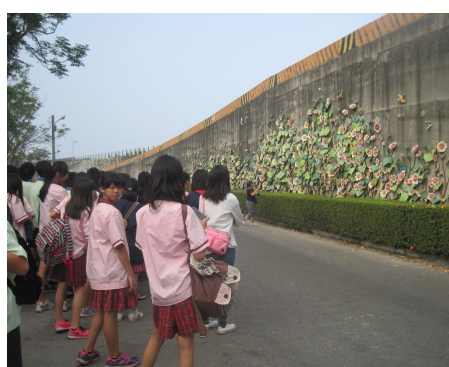
一、二、三年級戶外教學 有益視力保健