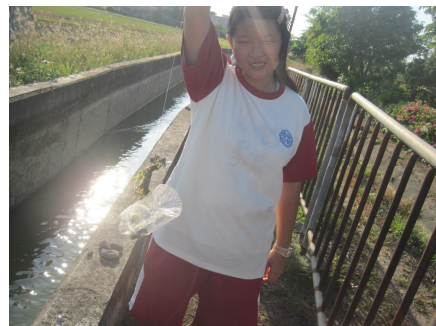
一年級水溝抓魚樂. 有益視力保健 (你看!我抓到了!厲害吧~~)