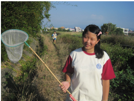
一年級自然課程進行戶外教學 水溝抓魚樂. 有益視力保健學生. 戶外 活動集體遠眺休息, 有益視力保健