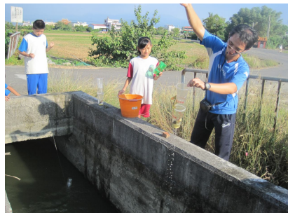
一年級自然課程進行戶外教學 水溝抓魚樂. 有益視力保健