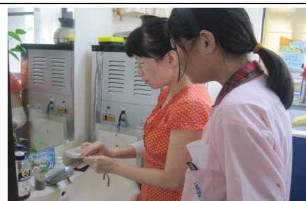
教導學生正確清洗眼鏡方法