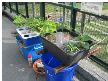
進行魚菜共生種植. 有益視力保健