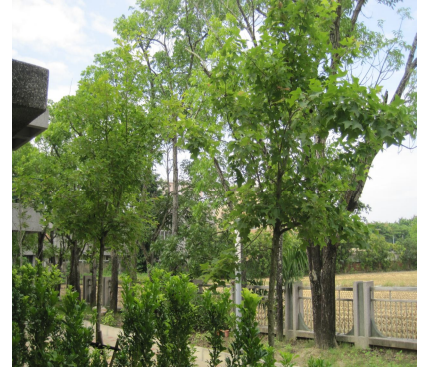
綠意盎然的校園有益視力保健