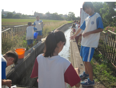
一年級自然課程進行戶外教學 水溝抓魚樂. 有益視力保健