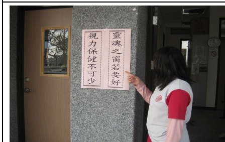
張貼視力保健宣導標語宣導 (學生觀看標語情形)