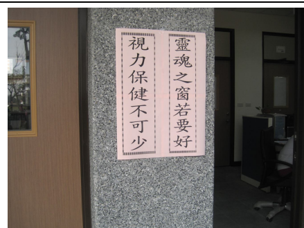
張貼視力保健宣導標語宣導