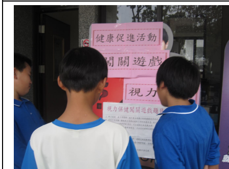
運動會擴大視力保健宣導