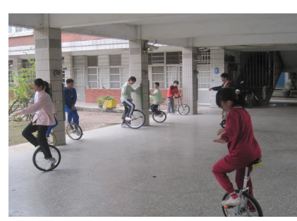
學生下課常騎獨輪車 ，有益視力保健