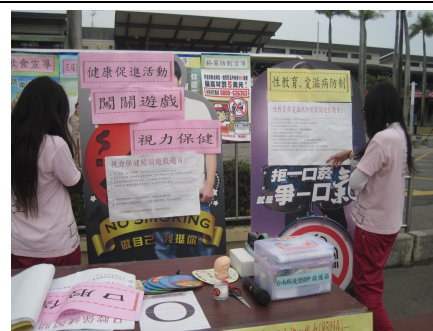
運動會擴大視力保健宣導 ，進行視力保健有獎徵答活動