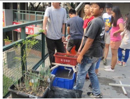
學生下課進行魚菜共生種植. 有益視力保健