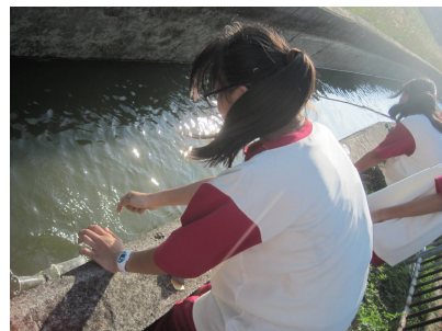
一年級自然課程進行戶外教學 水溝抓魚樂. 有益視力保健