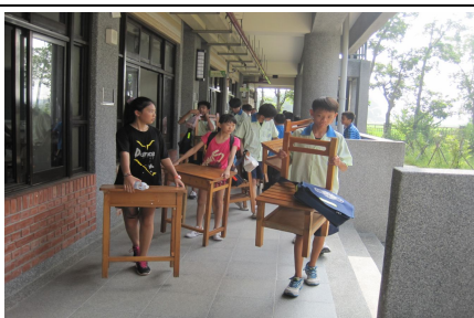
辦理新型課桌椅更換，替換適合自己身高的課桌椅，有益視力保健