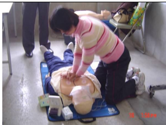
急救教育 CPR 及安全教育活動