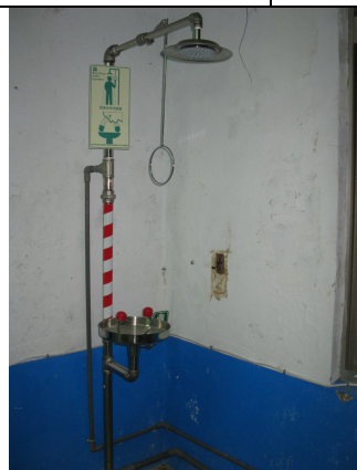
學校實驗室設置受傷淋浴設備