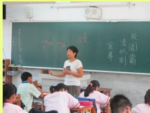
防治霸凌融入課程