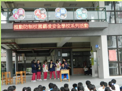
防治霸凌戲劇演出