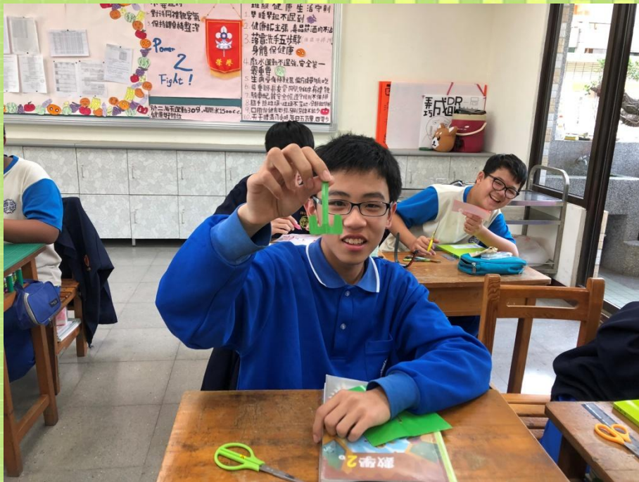
有趣的數學實作課