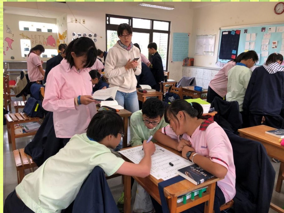
社會課-分組合作學習