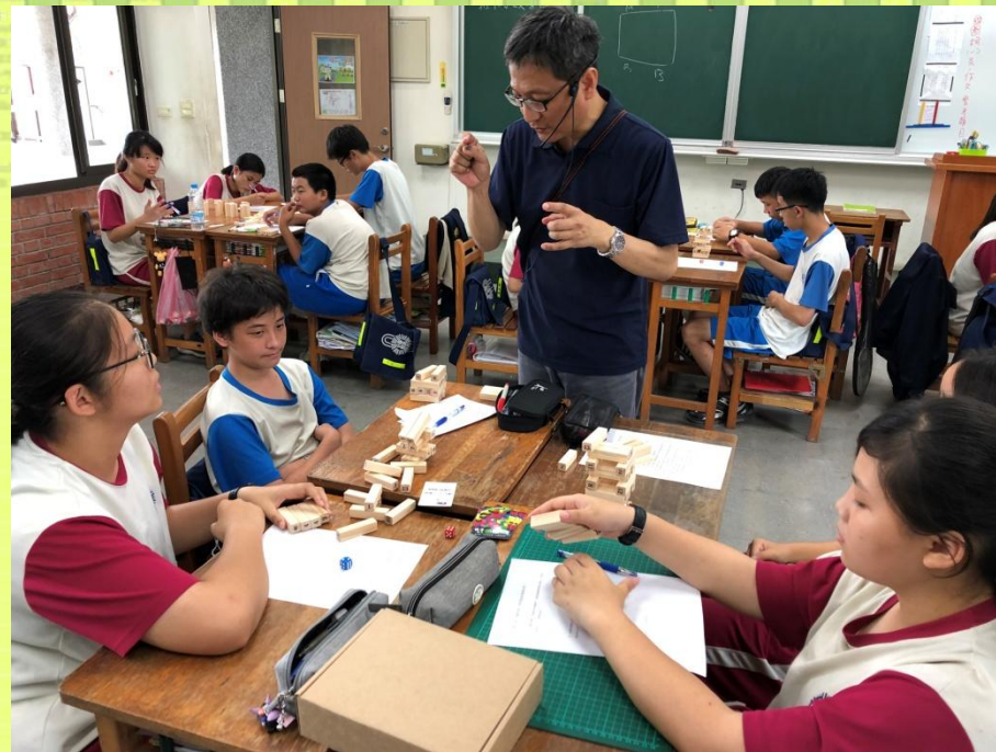
桌遊融入數學教學