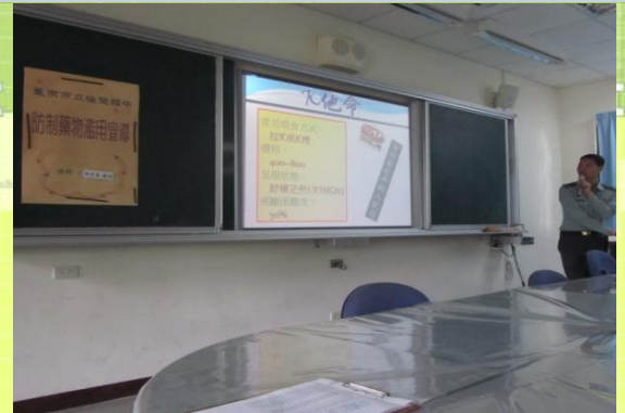
防制藥物濫用研習