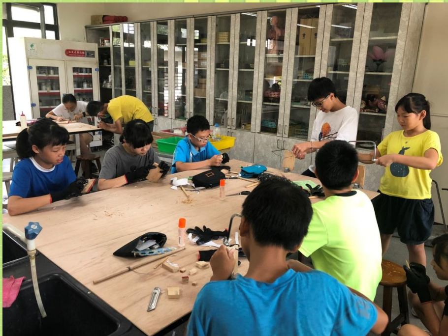
自然課-敲敲啄木鳥製作