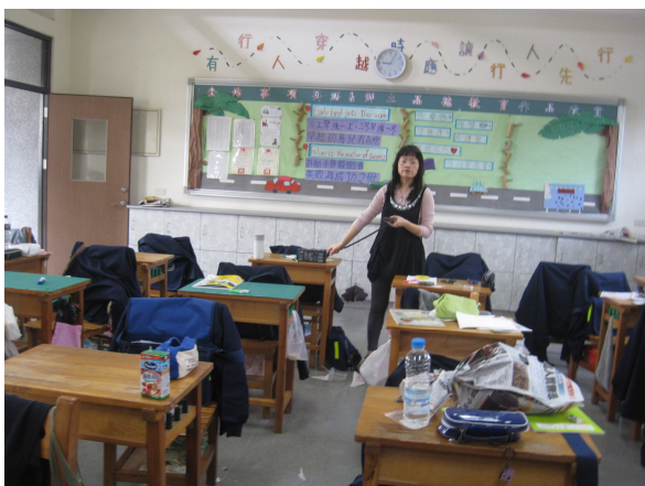
每學期進行班級桌面照度檢查， 黑板不低於 350 米燭光