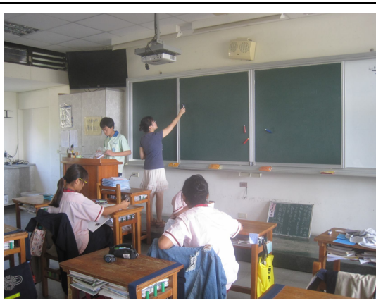
每學期進行黑板照度檢查， 黑板不低於 500 米燭光