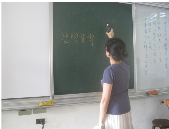
每學期進行黑板照度檢查， 黑板不低於 500 米燭光