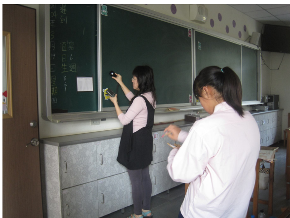
每學期進行黑板照度檢查， 黑板不低於 500 米燭光