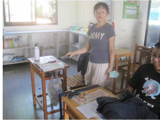
每學期進行班級桌面照度檢查， 黑板不低於 350 米燭光