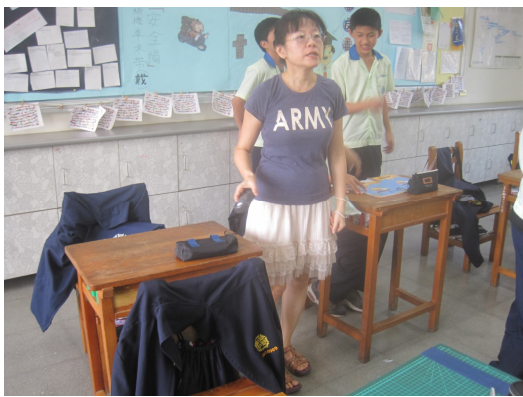
每學期進行班級桌面照度檢查， 黑板不低於 350 米燭光