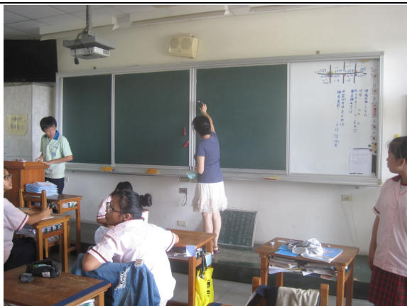
每學期進行黑板照度檢查， 黑板不低於 500 米燭光