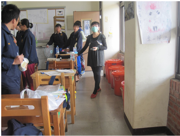
每學期進行班級桌面照度檢查， 黑板不低於 350 米燭光