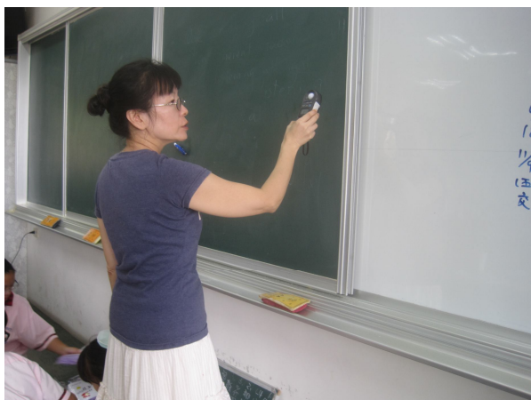
每學期進行黑板照度檢查， 黑板不低於 500 米燭光