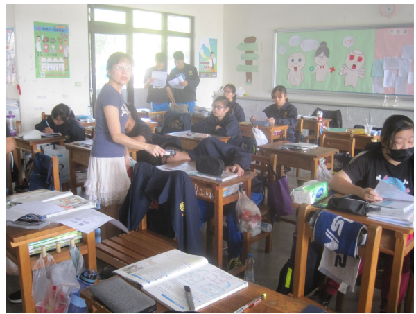
每學期進行班級桌面照度檢查， 黑板不低於 350 米燭光