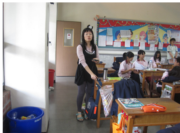
每學期進行班級桌面照度檢查， 黑板不低於 350 米燭光