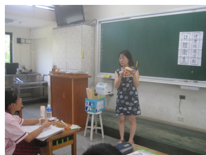
護理師口腔衛生宣導(貝式刷牙法)