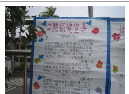
健康促進宣導活動-口腔保健