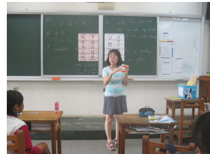
護理師衛教良好口腔衛生