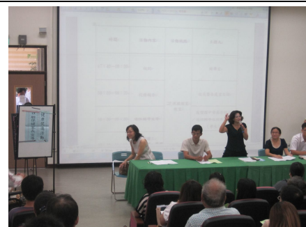
口腔保健家長宣導