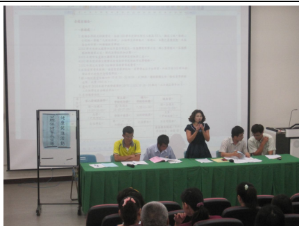
口腔保健家長宣導