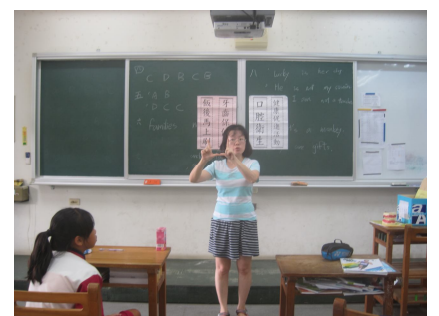
護理師衛教牙線的使用