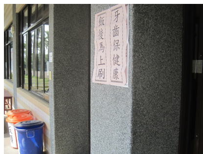
學生觀看口腔保健宣導標語情形