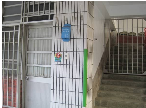
學校安全設施- 裝設後壁警察局巡邏箱