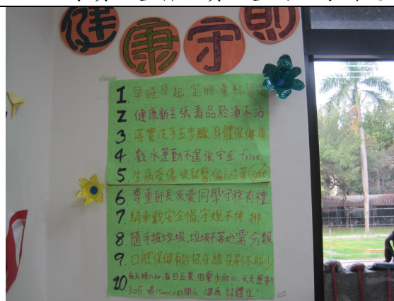
學校強調班級和諧氣氛建立班級榮譽制度 (班級公佈欄佈置建立班級生活公約)