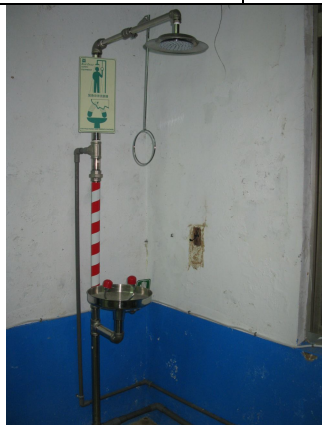
學校實驗室設置受傷淋浴設備