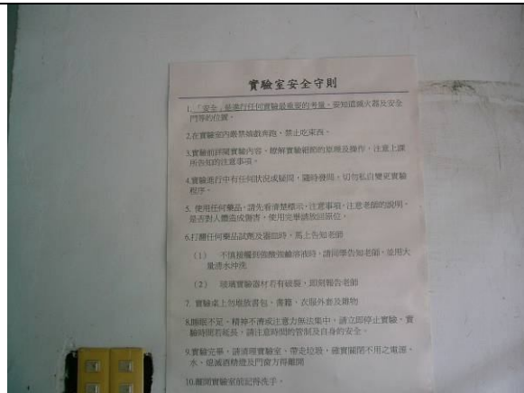
學校安全設施- 化學實驗室標示實驗室安全守則規定