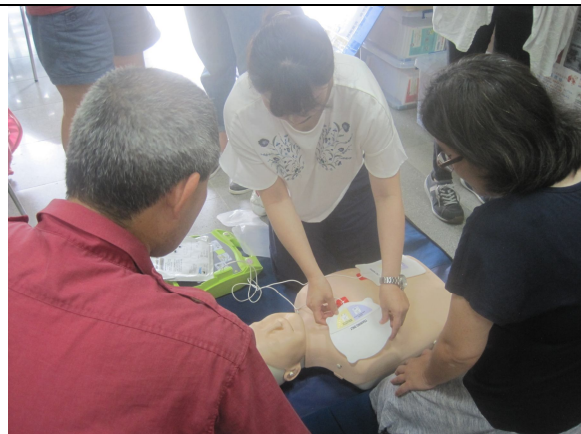
急救教育 CPR 及安全教育活動