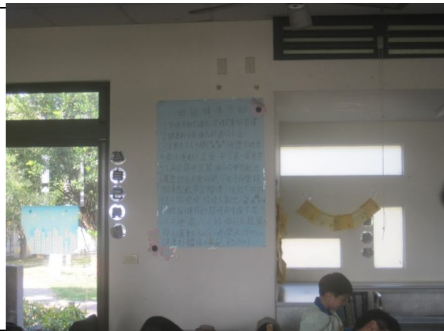
說明：制定健康生活守則 (9年2班)