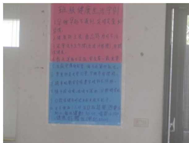
說明：班級教室佈置比賽-制定健康生活守則 (9年3班)