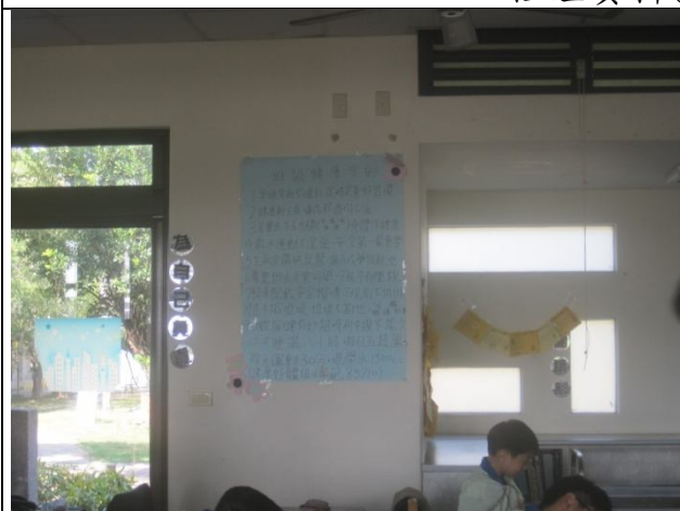
說明：班級制定健康生活守則 (9年2班)