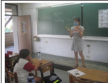
護理師口腔衛生宣導(貝式刷牙法)