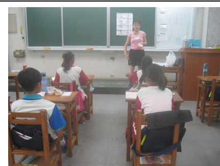
護理師衛教良好口腔衛生