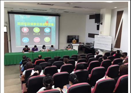
口腔保健家長宣導