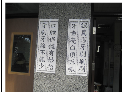
口腔保健宣導標語情形