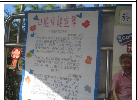
健康促進宣導活動-口腔保健