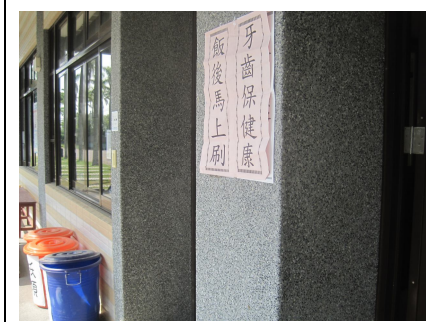
學生觀看口腔保健宣導標語情形