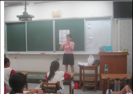
護理師衛教牙線的使用