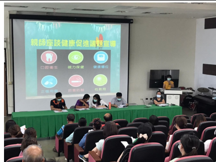
口腔保健家長宣導