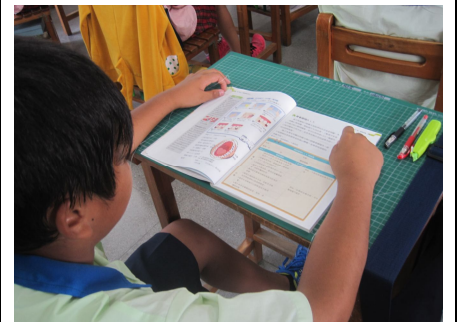
口腔衛生教學活動 (學生認真觀看口腔單元)