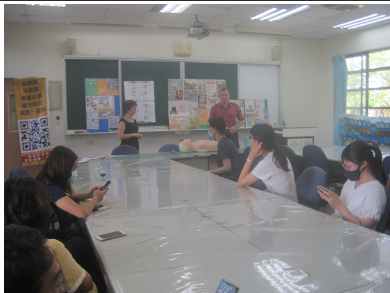
辦理學校教職員工急救教育 CPR 研習訓練活動