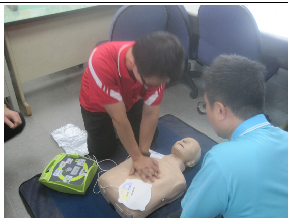
學校教職員工急救教育 CPR 教學活動