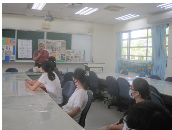
全校教職員工參加急救教育 CPR 研習訓練活動