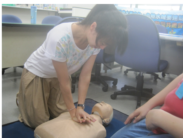
學校教職員工急救教育 CPR(心臟按壓)教學活動