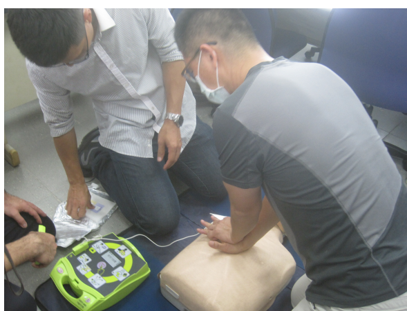
學校教職員工急救教育 CPR(心臟按壓)教學活動