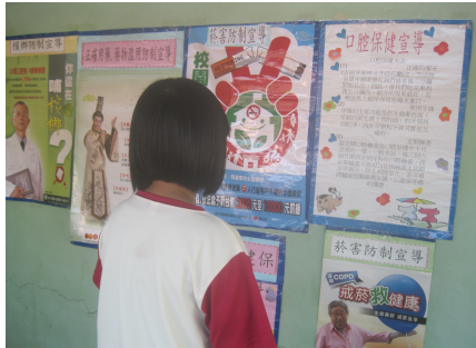
健康促進宣導活動-口腔保健