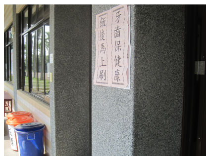
學生觀看口腔保健宣導標語情形