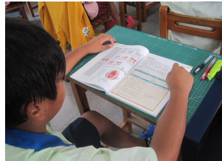
口腔衛生教學活動 (學生認真觀看口腔單元)