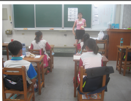
護理師衛教良好口腔衛生