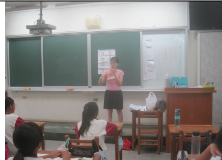
護理師衛教牙線的使用