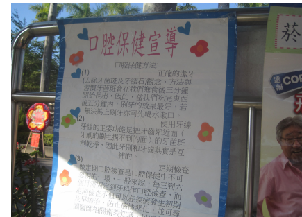
健康促進宣導活動-口腔保健