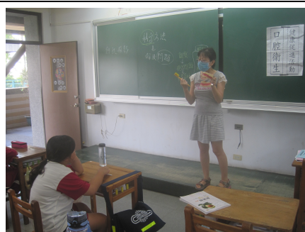
護理師口腔衛生宣導(貝式刷牙法)