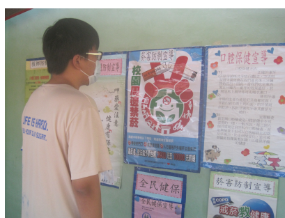
健康促進宣導活動-口腔保健