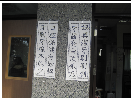
口腔保健宣導標語情形