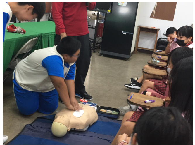
辦理學校學生急救教育 CPR 研習教學活動 學生實際操作情形