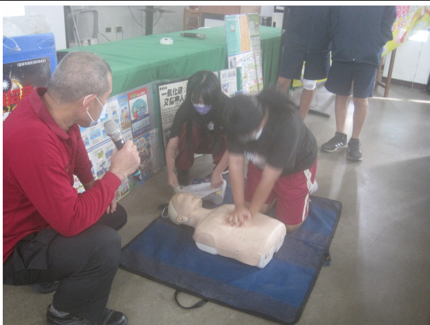
辦理學校學生急救教育 CPR 研習教學活動 CPR 研習訓練活動情形