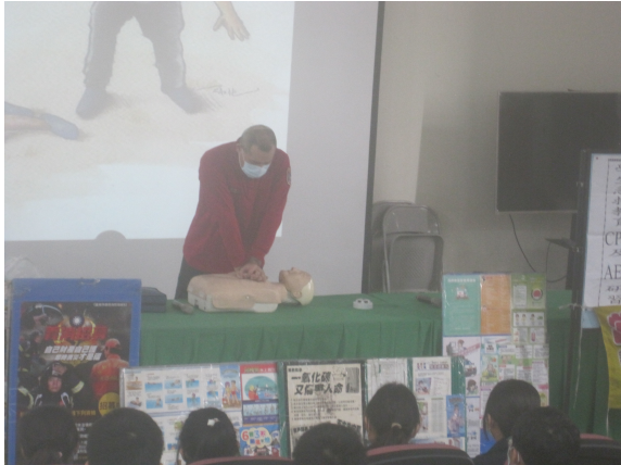
辦理學校學生急救教育 CPR 研習訓練活動