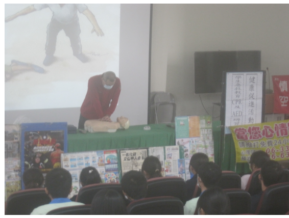
辦理學校學生急救教育 CPR 研習訓練活動