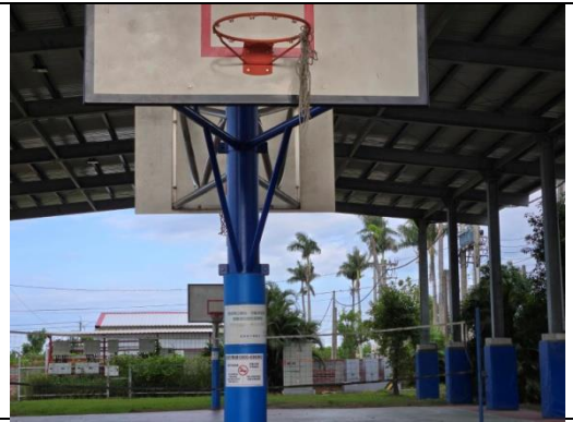
利用文宣向家長宣導健康促進議題--禁菸宣導