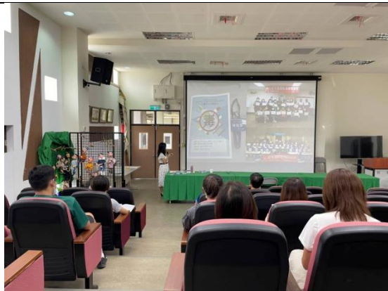
利用班親會, 向家長宣導健康議題