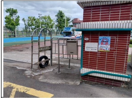
利用文宣向家長宣導健康促進議題--禁菸宣導