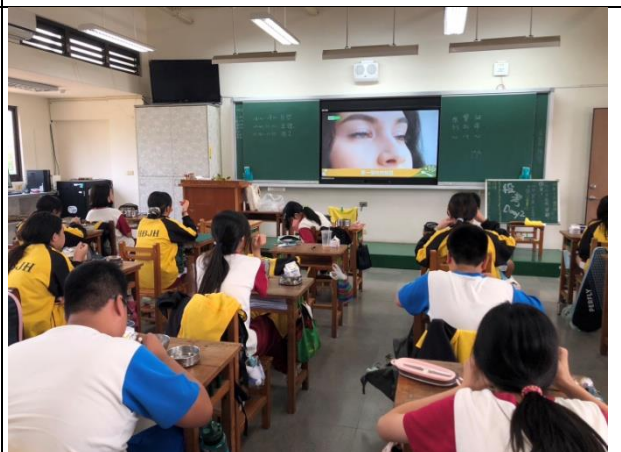
各班進行餐前5分鐘影片宣導-師生共同實踐健康生活