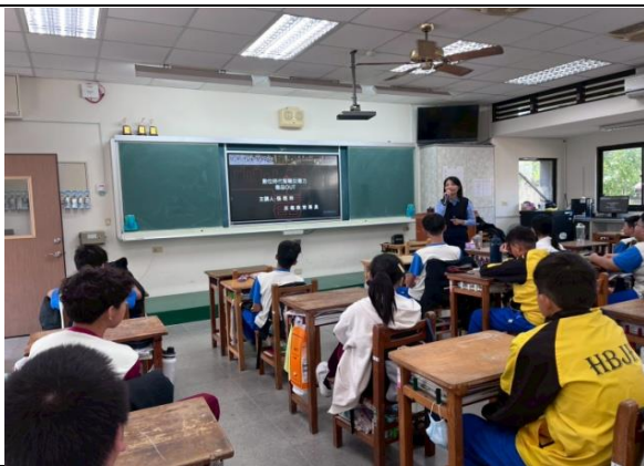
正確用藥(反毒)-入班宣導活動