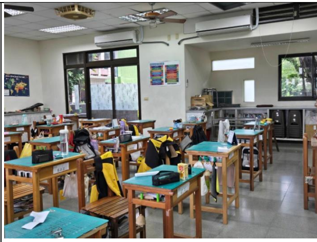
實踐健康生活-下課教室淨空