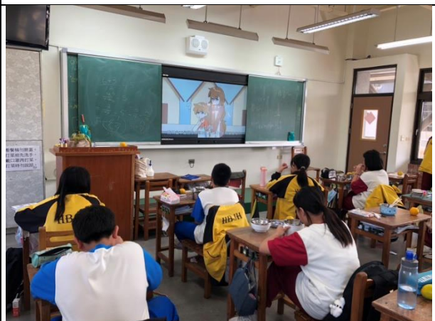
各班進行餐前5分鐘影片宣導-師生共同實踐健康生活