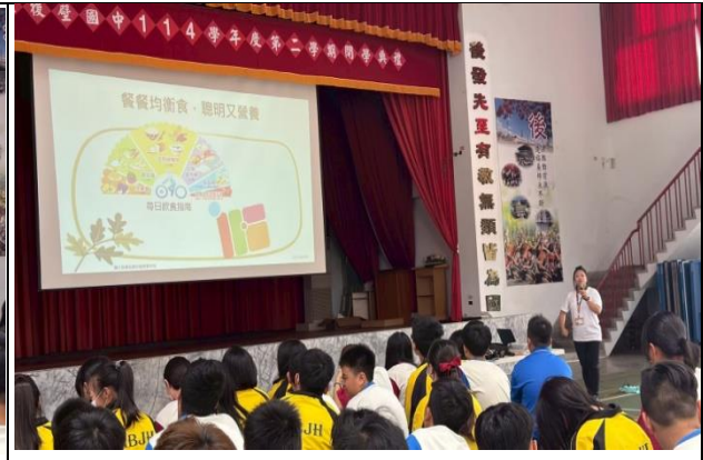
結合衛生所進行營養教育宣導活動