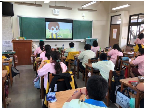
各班進行餐前5分鐘影片宣導-師生共同實踐健康生活