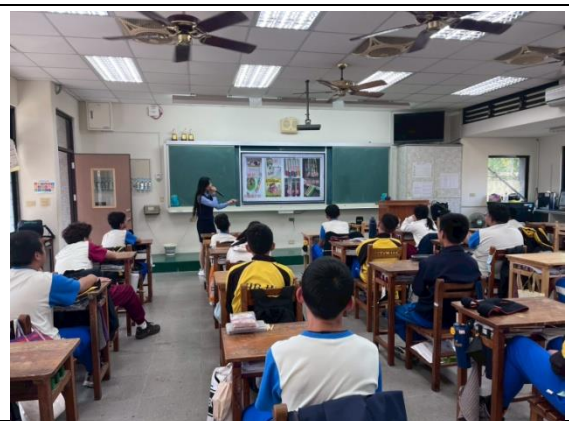
正確用藥(反毒)-入班宣導活動