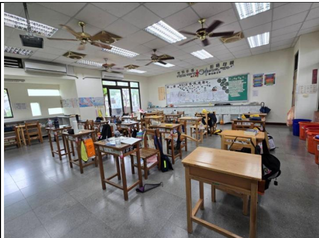
實踐健康生活-下課教室淨空