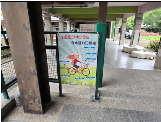
「安全教育」:張貼在走廊旁的安全教育生活