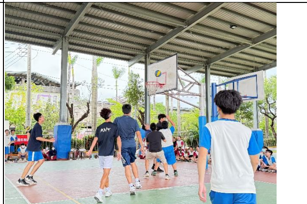
辦理班際球賽教職同仁與學生一同實踐健康生活