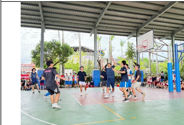
辦理班際球賽教職同仁與學生一同實踐健康生活