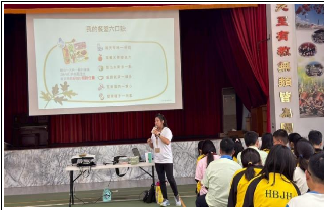
結合衛生所進行營養教育宣導活動