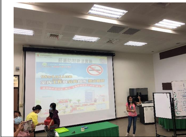
與衛生所結合辦理菸癮防治教育宣導活動實踐健康生活