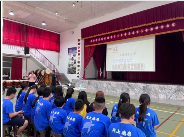
結合警察局進行交通安全及法治教育宣導活動