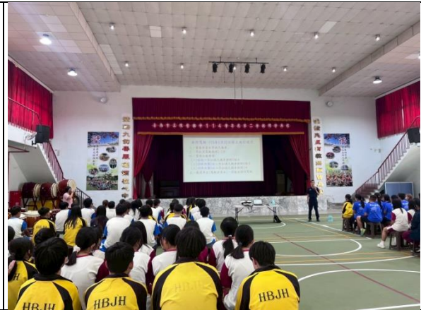
結合警察局進行交通安全及法治教育宣導活動