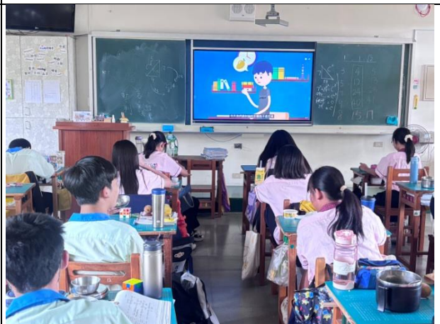
各班進行餐前5分鐘影片宣導-師生共同實踐健康生活