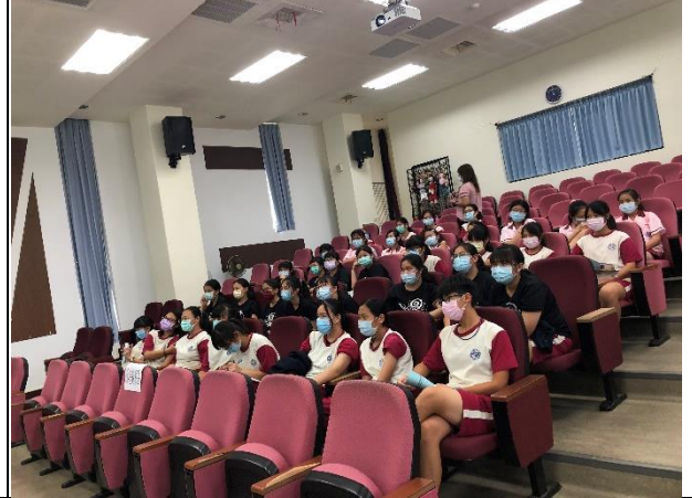
與衛生所結合辦理菸癮防治教育宣導活動實踐健康生活