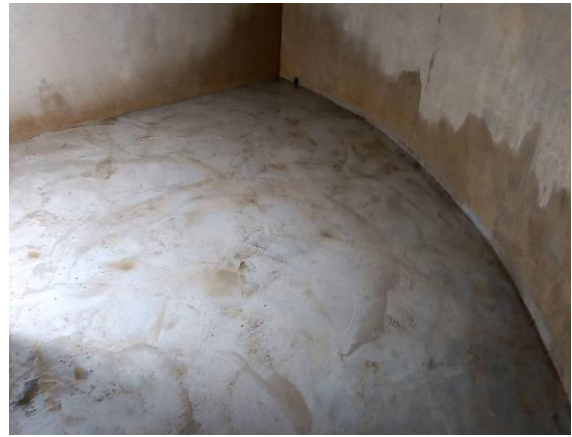
活動中心水塔清洗情形-後