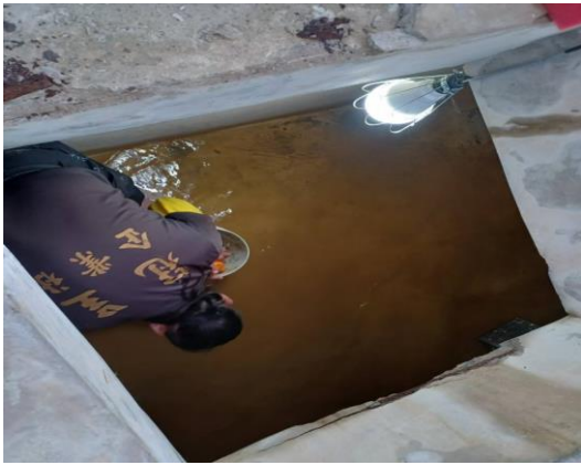
活動中心水塔清洗情形-前