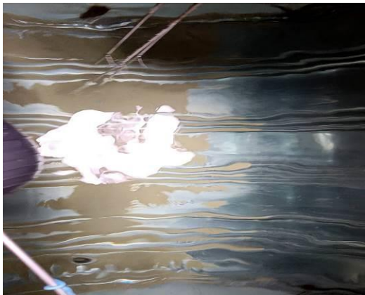
校園水塔清洗情形-前