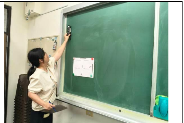
護理師各班級教室進行採光檢測情形