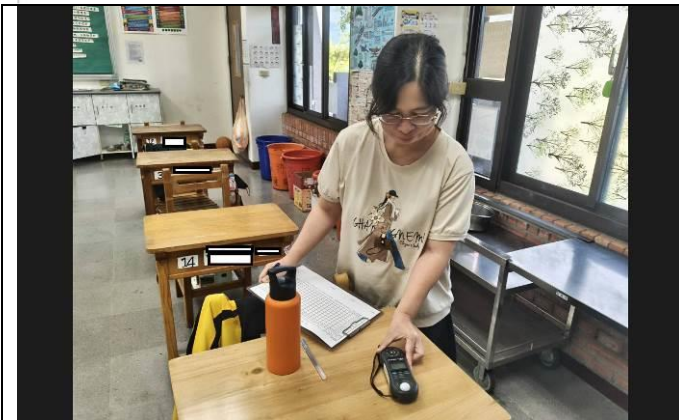
護理師各班級教室進行採光檢測情形