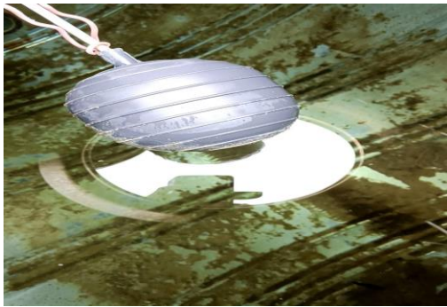
校園水塔清洗情形-前