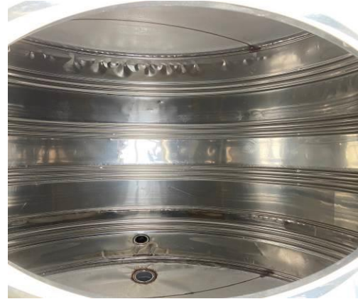
校園水塔清洗情形-後