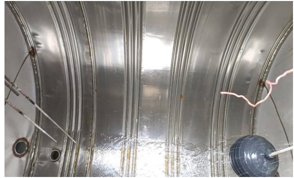
校園水塔清洗情形-後