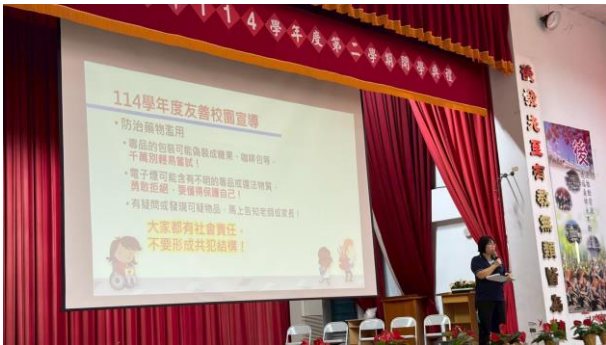
開學典禮進行友善校園-健康促進