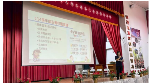
開學典禮進行友善校園-健康促進