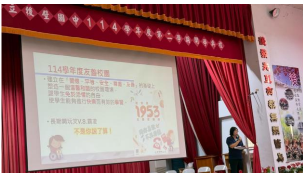
開學典禮進行友善校園-霸凌預防