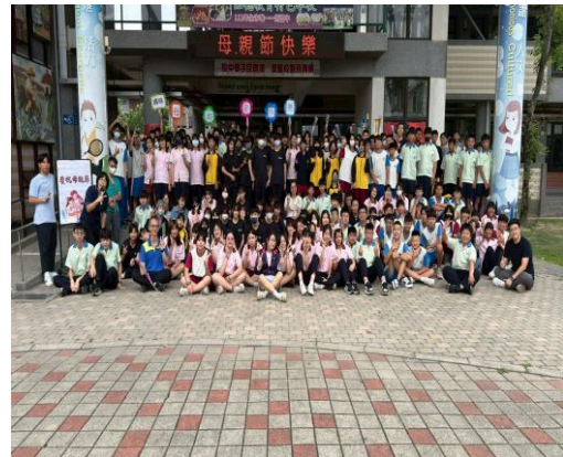
辦理母親節活動師生互動良好-團體合影