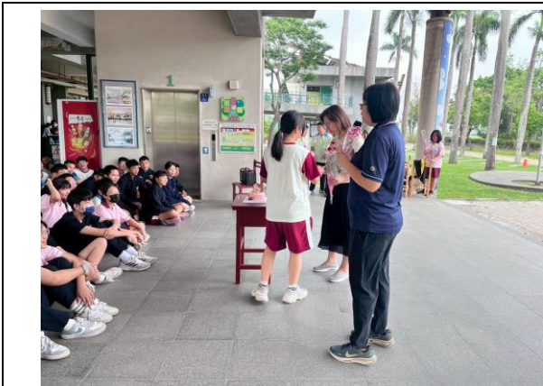
辦理母親節活動師生互動良好