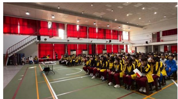
開學典禮進行友善校園-霸凌預防-學生認真聽講