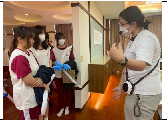
參與敏惠護專辦理之健康促進活動