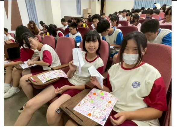
邀請心理師，辦理心理健康講座-學生認真情形