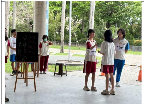
母親節活動（母語日暨反毒宣導）