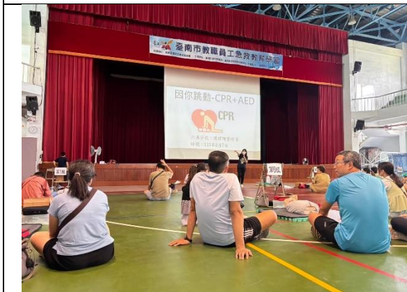
教職同仁參加 CPR 研習情形