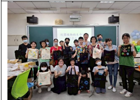
親職共學多元學習課程（植物辨識和環保袋製作、烘焙可愛麵包）