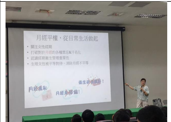
邀請許護理師辦理月經暨品德教育講座