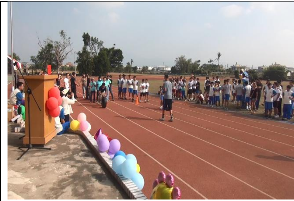
校慶運動會家長、志工共同參與活動情形

7-1-1學校實施正式或非正式課程、健康活動、研習訓練時，有邀請社區人士共同參與，發揮學校健康促進之影響力(4%)。