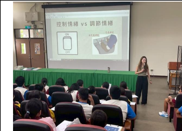
邀請心理師，辦理心理健康講座