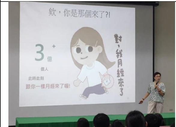
邀請許護理師辦理月經暨品德教育講座