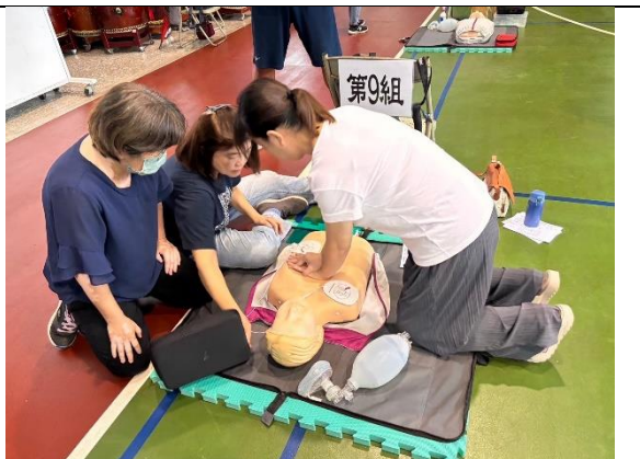
教職同仁參加 CPR 研習情形