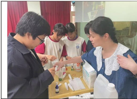
參與敏惠護專辦理之健康促進活動