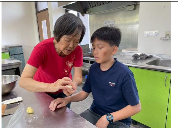
親職共學多元學習課程（植物辨識和環保袋製作、烘焙可愛麵包）