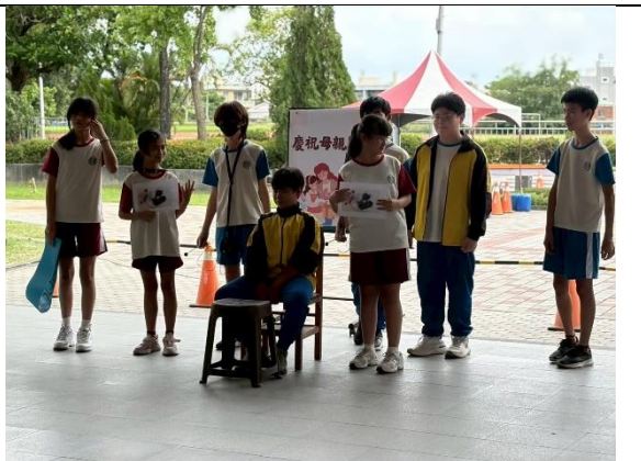
母親節活動（母語日暨反毒宣導）