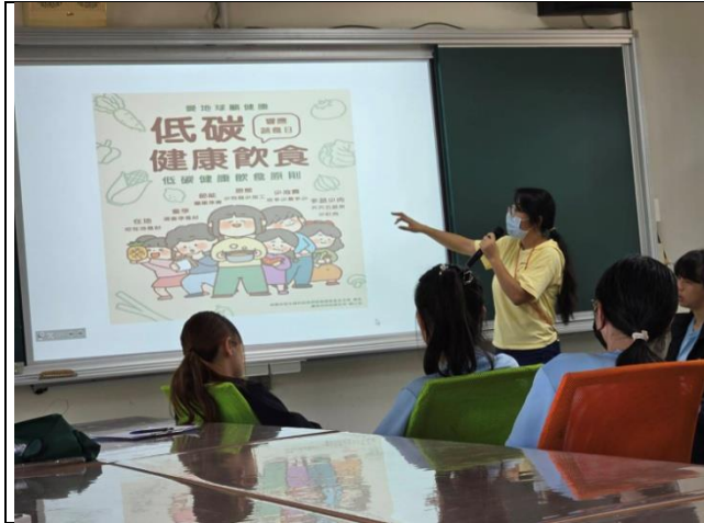
說明：後壁區衛生所-健康促進宣導

7-2-1學校召開健康促進相關會議邀請社區重要人士參加(如:里長、學校周邊商家、課後照顧機構、醫療衛生單位、幼教單位、樂齡學習中心、校外健康團體等社區代表)，共同合作推動健康促進議題(4%)。