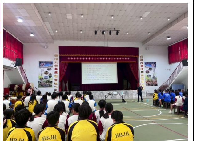
警察局-進行交通安全宣導活動