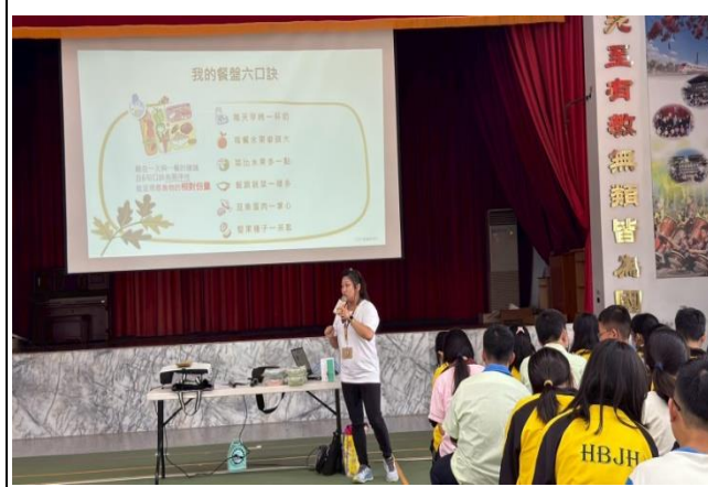
說明：衛生局-進行營養教育