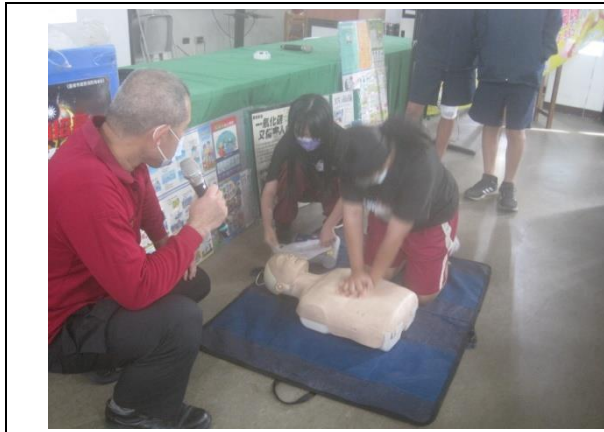
說明：消防局-學生急救教育 CPR 研習