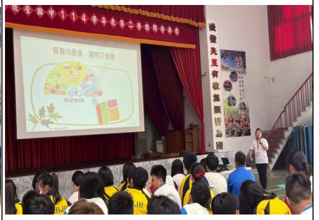
說明：衛生局-進行營養教育