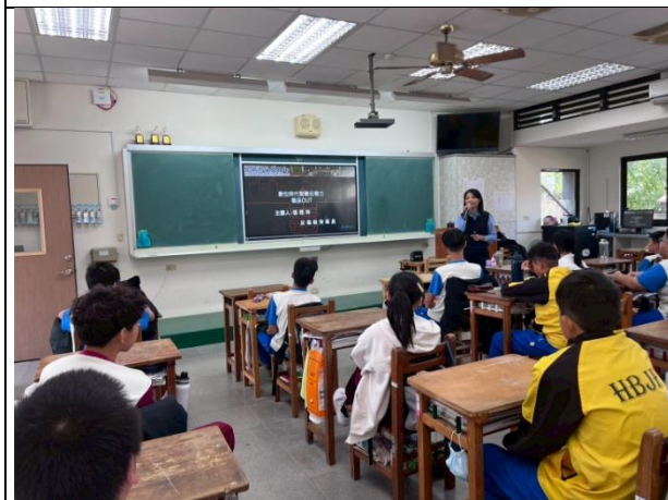
說明：警察局-進行反毒宣導活動