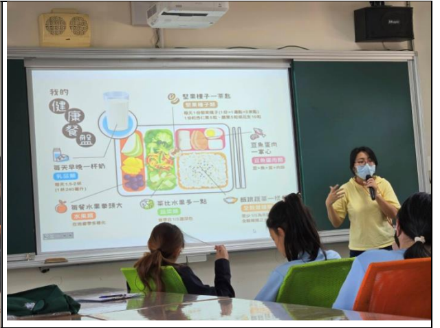
說明：後壁區衛生所-健康促進宣導