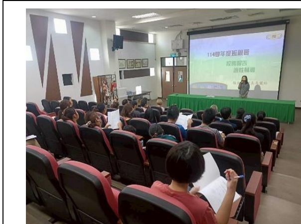
說明：辦理親職教育講座暨班親會