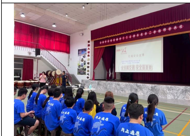
警察局-進行交通安全宣導活動