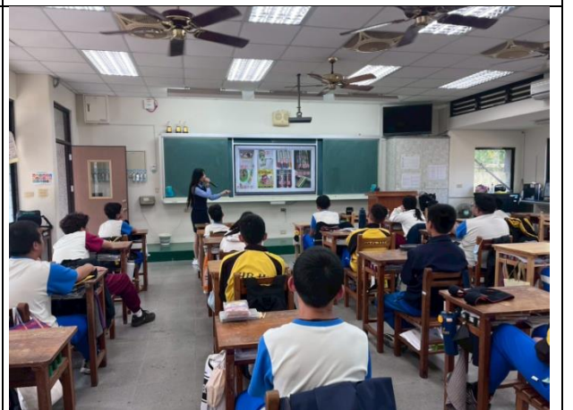
警察局-警察局-進行反毒宣導活動