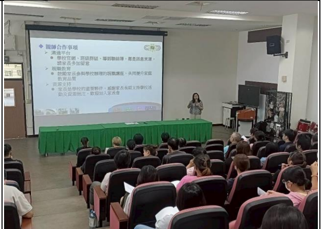
說明：辦理親職教育講座暨班親會